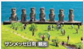
サンメッセ日南 観光