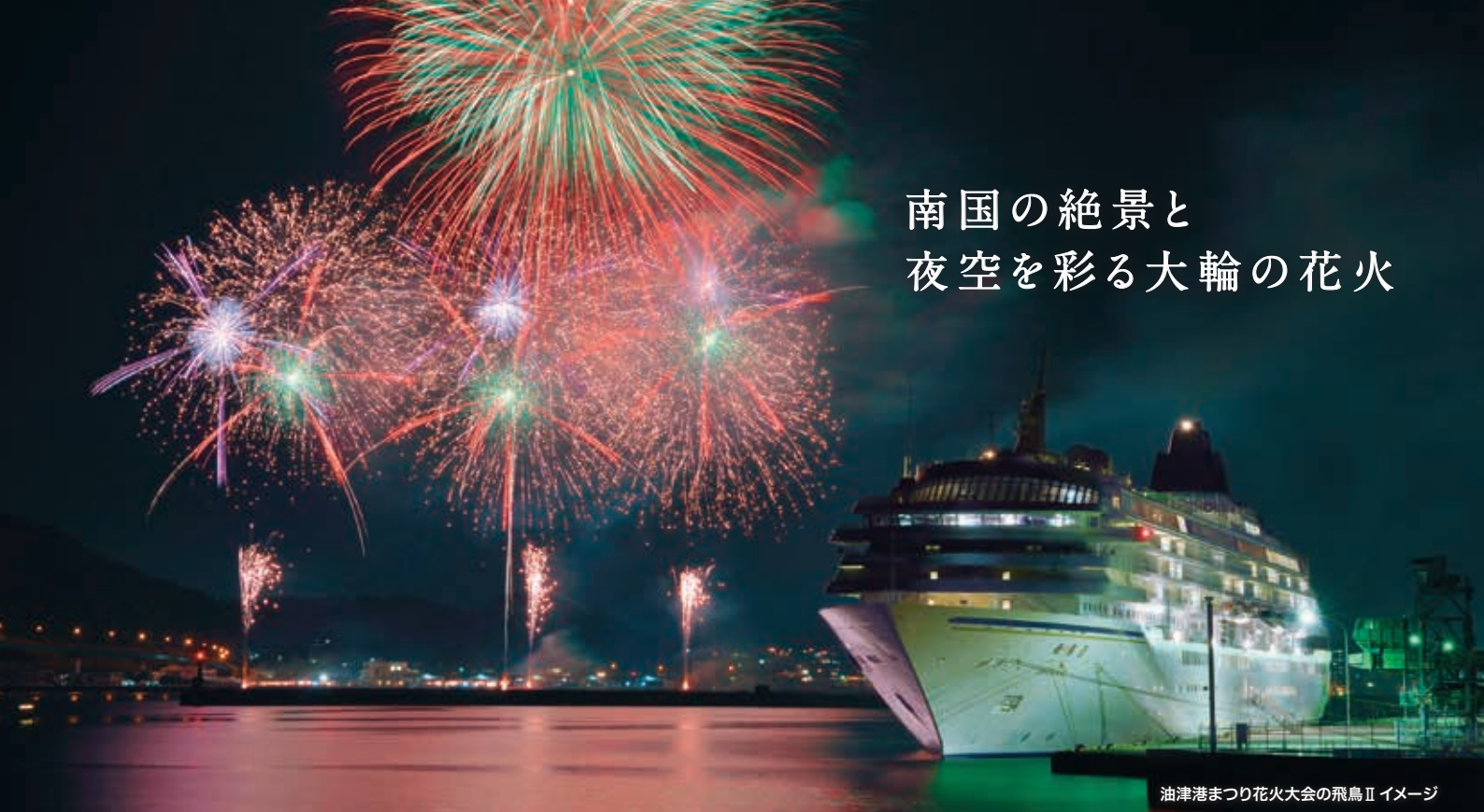
油津港まつり花火大会の飛鳥IIイメージ