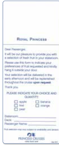
フルーツオーダー（イメージ）