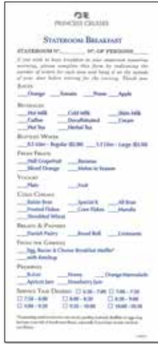
ブレックファストオーダー（イメージ）

客室電話の“RoomService”ボタンでご注文の場合は5ドルのデリバリーフィーが加算されます。また、専用アプリ「プリンセス・クルーズ」でご注文の場合は、1クルーズにつき14.99ドルのデリバリーフィーが加算されます（プリンセス・プラス、プリンセス・プレミアは無料）。