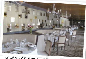
メインダイニング アンフォラ

※一部を除きほとんどのアルコール飲料をいつでも楽しめます ※参考:事前購入価格 US$89×7泊 = US$623(約93,000円) こちらがご旅行代金の中に含まれています。