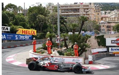
ホテル・フェアモント・モンテカルロ前のヘアピンカーブは見せ場のひとつ。