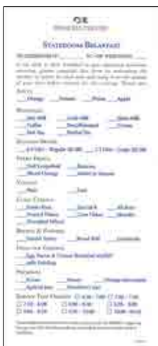
コンチネンタルブレックファスト(イメージ)

※ルームサービスのスタッフには、船内会計に加算されるチップは分配されません。お客様のご判断でチップをお渡しください(目安:1回につき1~2ドル)。チップ用の現金をお持ちでない場合は、ルームサービスのオーダー用紙裏面にある「Gratuity」欄にチップ額をご記入頂きますと、後日船内会計に加算されます。