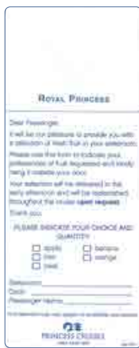
フルーツオーダー(イメージ)