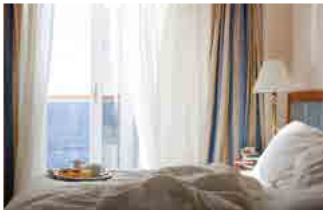
バルコニー客室(イメージ)