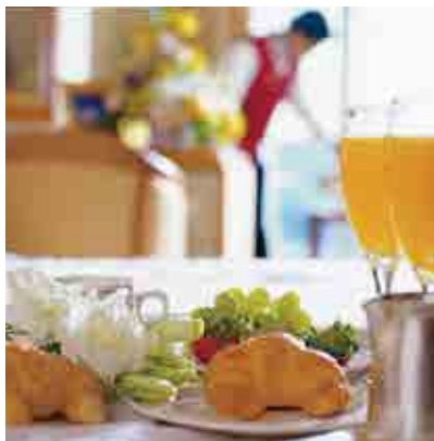
ルームサービス(イメージ)