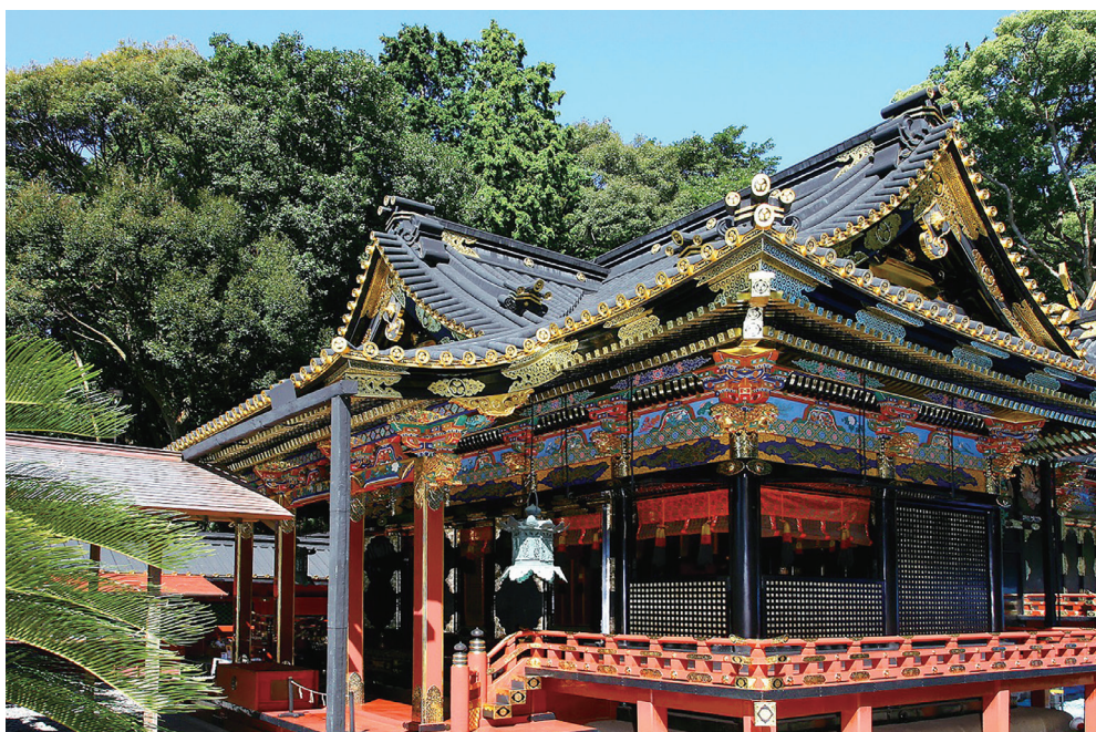
久能山東照宮