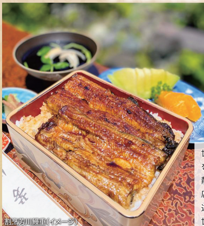
割烹芳川鰻重(イメージ)