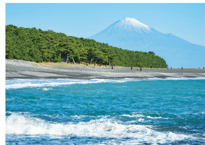
三保松原から眺める富士山 (イメージ)

貸切バス会社 | 静鉄ジョイステップバス(株)、 アンピアバス、大鉄観光、または吉田観光(株)