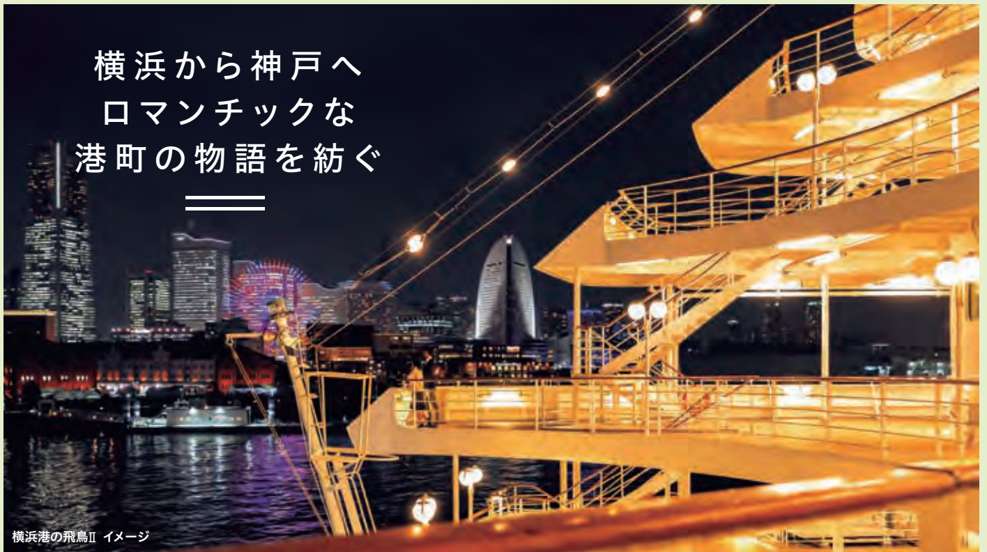
横浜港の飛鳥II イメージ