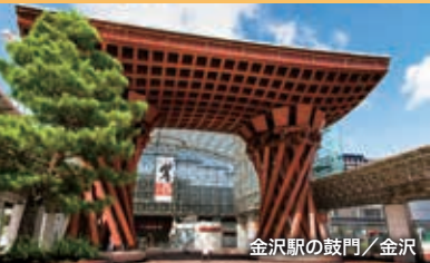
金沢駅の鼓門/金沢