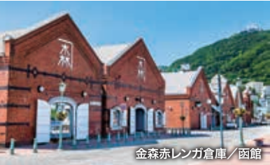
金森赤レンガ倉庫/函館