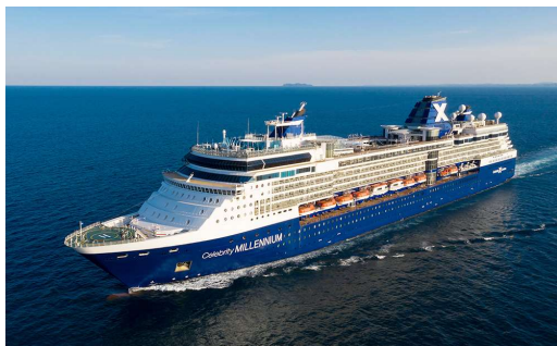
セレブリティ・ミレニアム