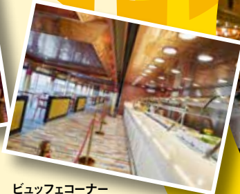
ビュッフェコーナー お好きな時間に自由に 気軽にお食事が出来ます。