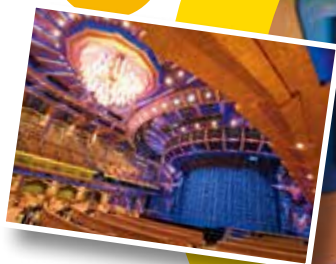
シアター 1,300名収容のシアターでは、 様々なエンターテイメントショーを 鑑賞出来ます。