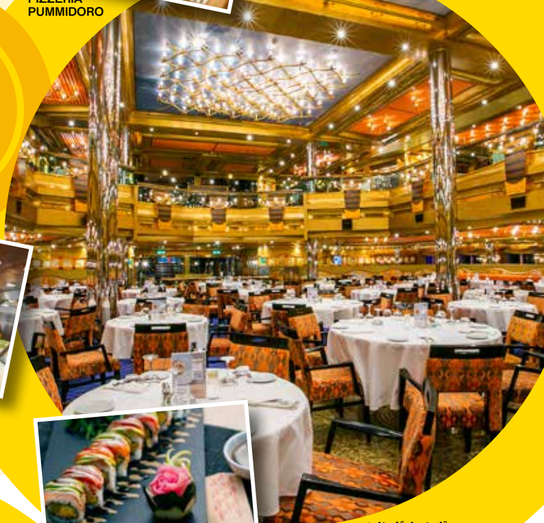
メインダイニング アラカルトのコース料理となります。