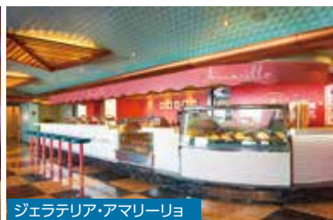
ジェラテリア・アマリーリョ