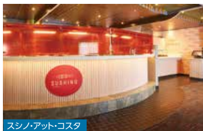
スシノ・アット・コスタ