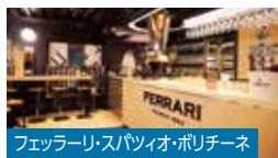
フェッターリ・スパツィオ・ポリチーネ