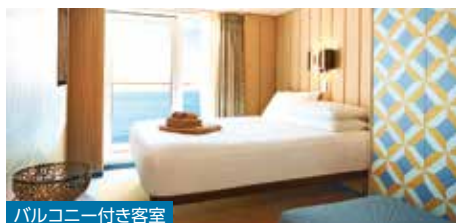
バルコニー付き客室