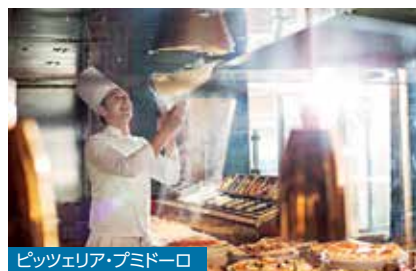
ピッツェリア・プミドーロ