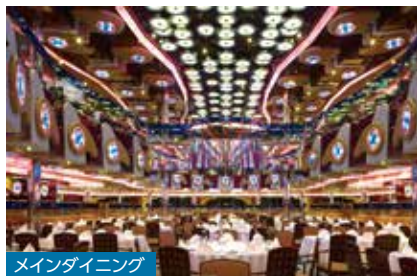
メインダイニング

渡り鳥がコンセプトの美しい装飾やオブジェが印象的。メニューはイタリア料理が中心です