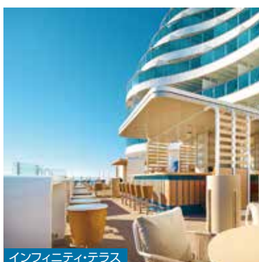
インフィニティ・テラス

眺めのよい船尾の「インフィニティ・テラス」や、アマルフィの太陽にインスパイアされたインテリアの「ソレミオ・ビューティスパ」では、ゆったりとした上質な時間で日常の疲れを癒していただけます。食事を 즐기すぎた後は、海を眺めながらデッキウォークをしたり、ヨガやジム、スポーツコートでエクササイズも。