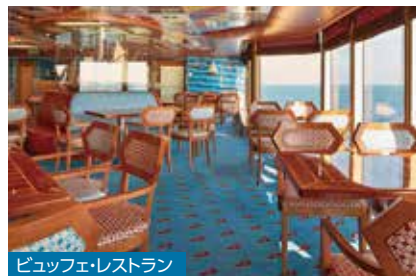
ビュッフェ・レストラン

渡り鳥がコンセプトの美しい装飾やオブジェが印象的。メニューはイタリア料理が中心です