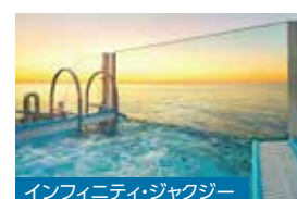
インフィニティ・ジャクジー