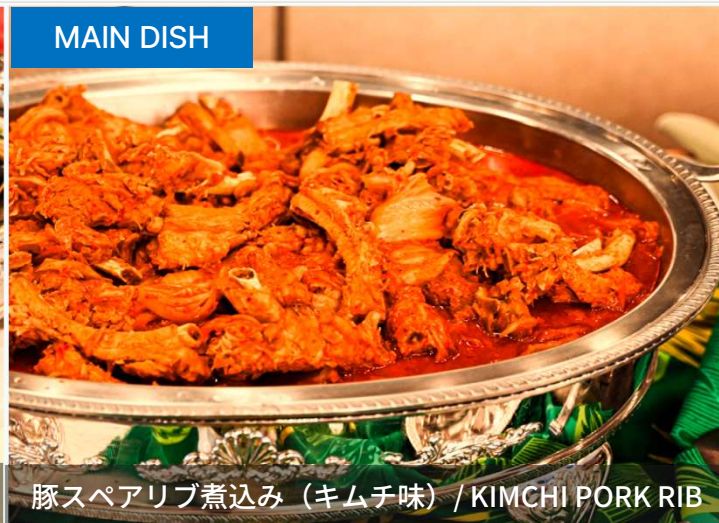
豚スペアリブ煮込み (キムチ味) / KIMCHI PORK RIB