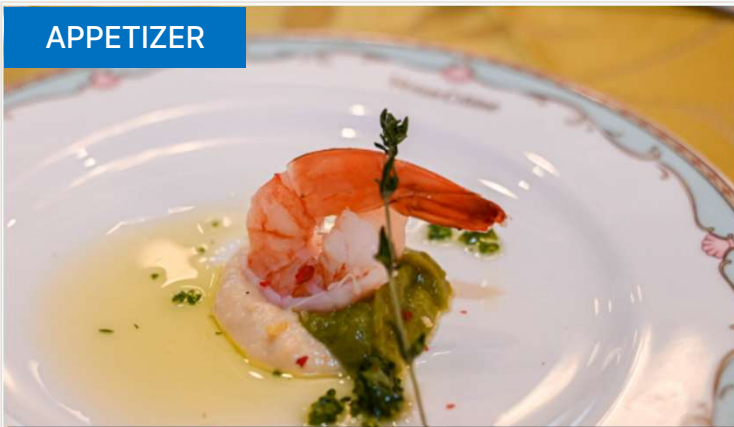
ハーブを添えたシュリンプ・コンフィと二種のピューレ / SHRIMP CONGIT with HERB & DUAL PUREES