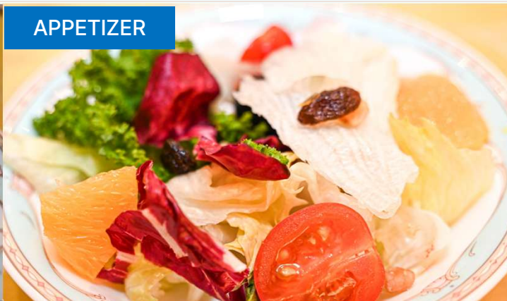
フレッシュフルーツ入りガーデンサラダ / GARDEN SALAD with FRESH FRUIT