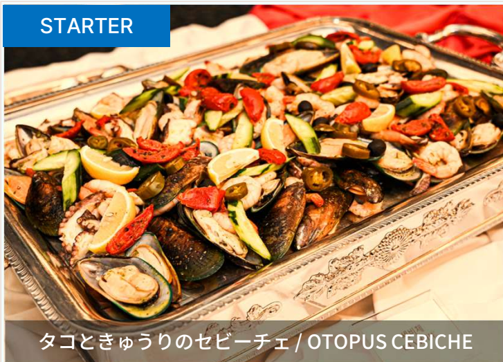
タコときゅうりのセビーチェ / OTOPUS CEBICHE