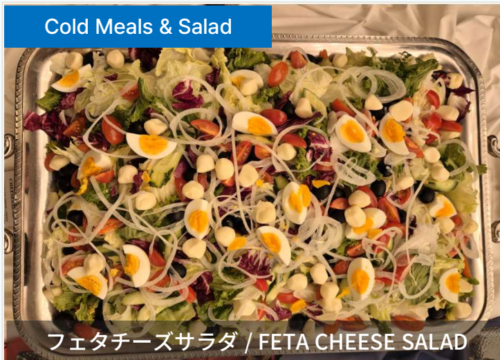
フェタチーズサラダ / FETA CHEESE SALAD