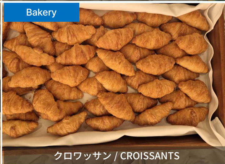
クロワッサン / CROISSANTS