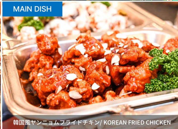
韓国風ヤンニョムフライドチキン / KOREAN FRIED CHICKEN