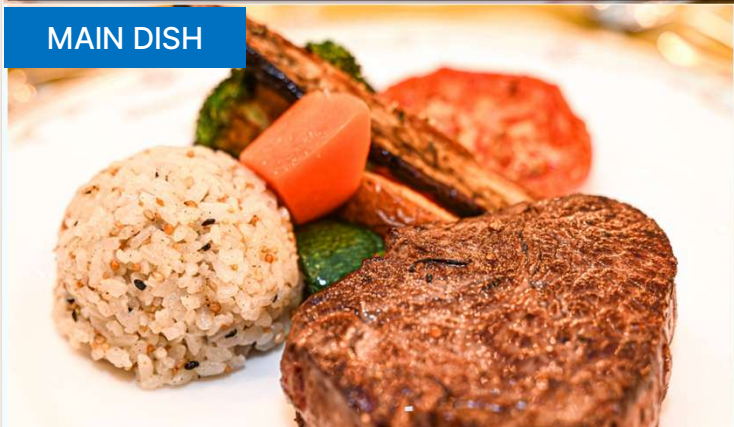
ロースト野菜を添えた牛フィレ肉のグリルステーキ / GRILLED BEFF TENDERLOIN STEAK with ROASTED VEGETABLE