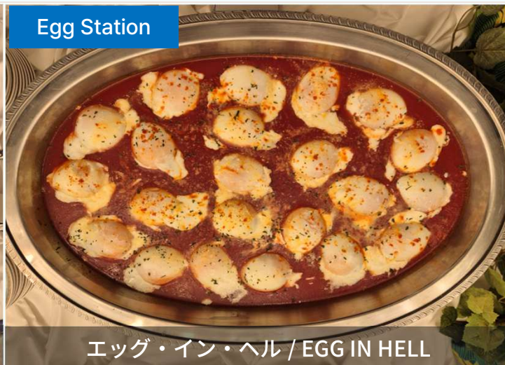
エッグ・イン・ヘル / EGG IN HELL