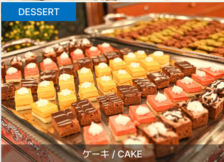
ケーキ / CAKE