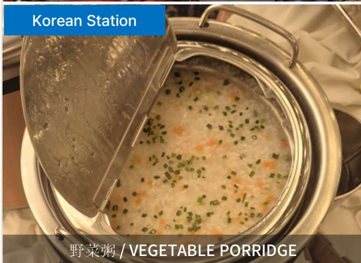
野菜粥 / VEGETABLE PORRIDGE