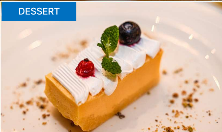
フレッシュベリー添えチーズケーキ / CHEESECAKE with FRESH BERRIES