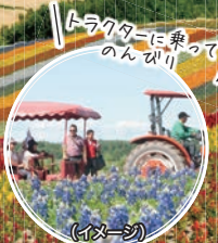
トラクターに乗ってのんびり(イメージ)