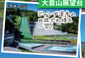
大倉山展望台(イメージ)