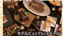
ホテルビュッフェ(イメージ)

3日目 小樽三角市場にご案内! 好きなお店で新鮮な海鮮昼食をお召し上がりください♪ (別途代金)