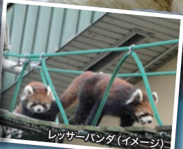
レッサーパンダ(イメージ)