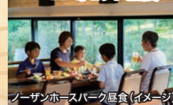
ノーザンホースパーク昼食(イメージ)

1日目 ポリュームたっぷり BBQセット昼食 家族みんなで楽しめる ホテルディナービュッフェ