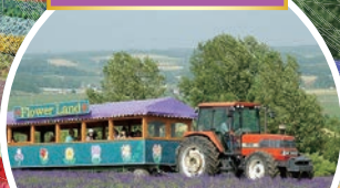
トラクターバス(イメージ) 花畑と十勝連峰の絶景を トラクターバスで駆け巡る!