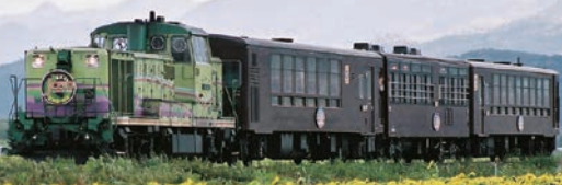
ノロッコ号(イメージ)