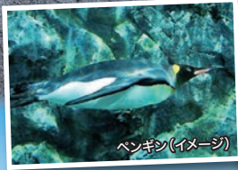
ペンギン(イメージ)