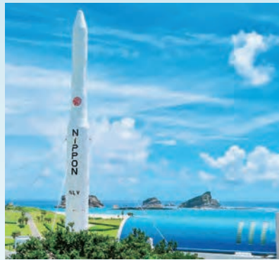
種子島宇宙センター

国際尺八コンクールにて世界チャンピオンの座を獲得。尺八キングと呼ばれ世界中で活躍する尺八奏者。