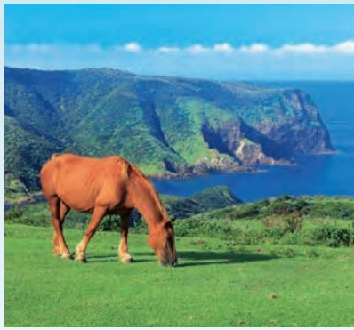
摩天崖から見た国賀海岸