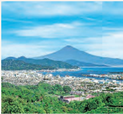
日本平からの景色