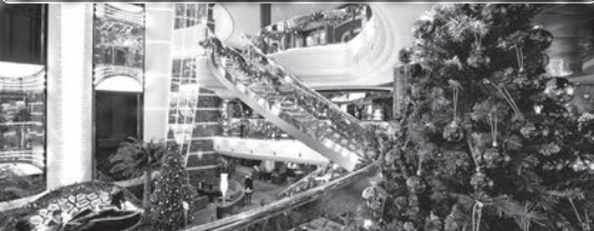
華麗なインフィニティ アトリウム