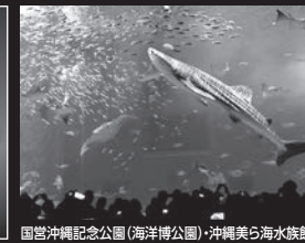
国営沖縄記念公園(海洋博公園)・沖縄美ら海水族館 九份(台湾・基隆)