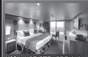
MSCヨットクラブデラックススイート