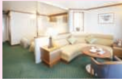
スイート A(1005~1018) B(1019 1020)

定員2名(35㎡ 10階、バストイレ・バルコニー付) ※ブルーレイプレーヤー、インターネット閲覧専用ノートパソコン付 ※スイートBは、救命ボートによりベランダの眺望が妨げられます。