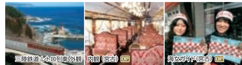
三陸鉄道レトロ列車外観 内観(宮古) OP