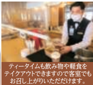
ティータイムも飲み物や軽食をテイクアウトできますので客室でもお召し上がりいただけます。