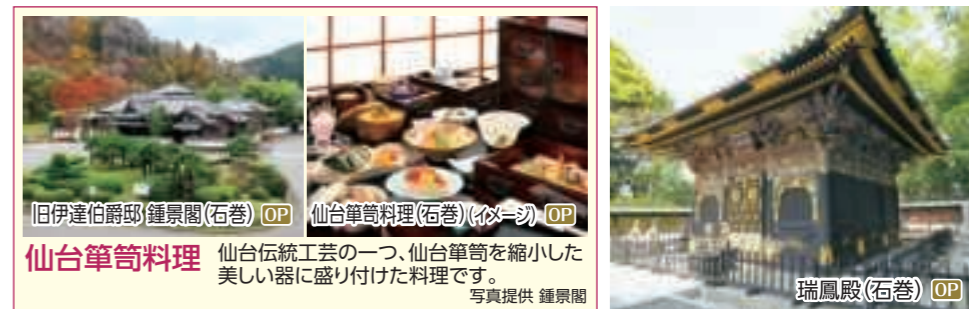
旧伊達伯爵邸 鍾景閣(石巻) OP 仙台筆筍料理(石巻)(伊達邸) OP 仙台筆筍料理 仙台伝統工芸の一つ、仙台筆筍を縮小した美しい器に盛り付けた料理です。