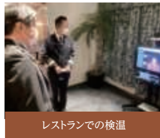
レストランでの検温

変わらない美味しさにより安心と安全を添えてお食事・ティータイムなどビュッフェを取り止め、スタッフが取り分けてご提供します。