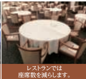
レストランでは座席数を減らします。