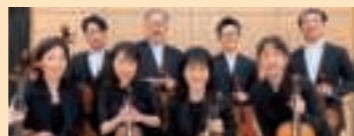
※出演メンバーは変更になる場合もございます。

中世貴族が聴いていたような、弦楽器の煌びやかな演奏をお届けします。震災を乗り越え、今まさに充実している仙台フィル名手たちの演奏をお楽しみください。