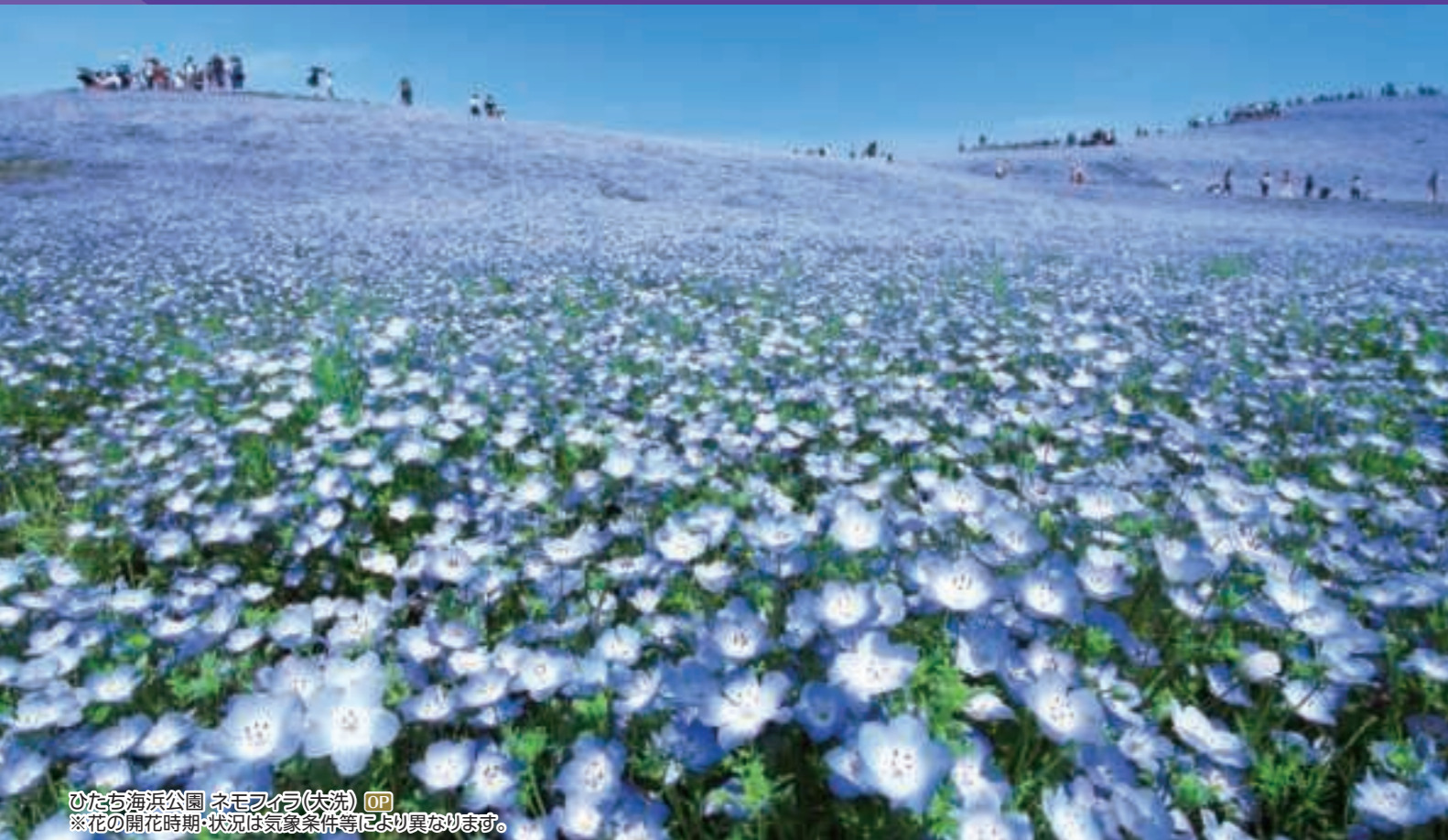
ひたち海浜公園 ネモフィラ(大洗) OP ※花の開花時期・状況は気象条件等により異なります。