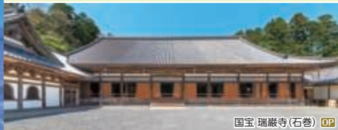
国宝 瑞巖寺(石巻) OP

世界三大漁場 三陸・金華山沖を背景に栄えた水産都市で豊かな食の宝庫です。石ノ森章太郎ゆかりの街としてのマンガ文化も楽しめます。