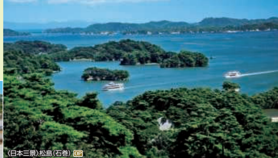
〈日本三景〉松島(石巻) OP