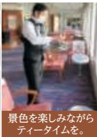
景色を楽しみながらティータイムを。