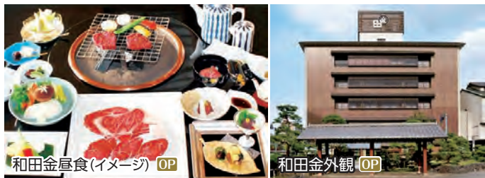
和税金昼食(イメージ) OP

味 元祖松阪肉“和税金”の昼食と 紀行 松坂城下町散策 II 松坂城下町散策(御城番屋敷、松坂城址、旧長谷川治郎兵衛家) ◆所要時間:約7.5時間 ◆お食事:昼食付