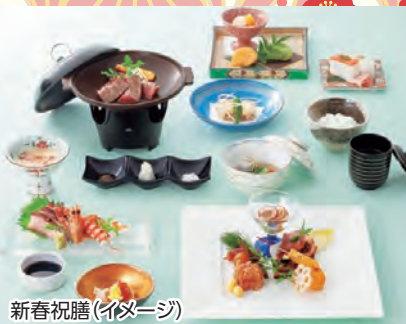
新春祝膳(イメージ)