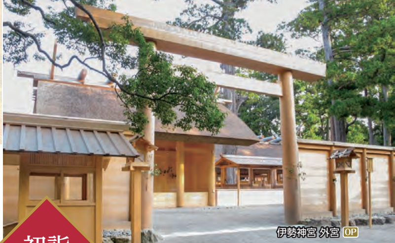
伊勢神宮 外宮 OP