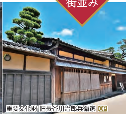
重要文化財 旧長谷川治郎兵衛家 OP