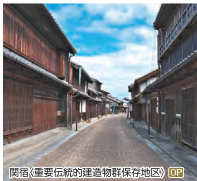
関宿<重要伝統的建造物群保存地区> OP