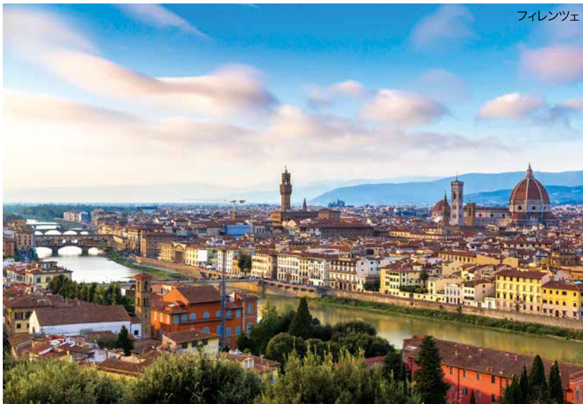
ルネッサンス文化が花開き、今も世界中の人を魅了する花の都。シンボルのドゥオモや、シニョーリア広場は中世そのままの野外美術館のようです。 ※オプションツアー