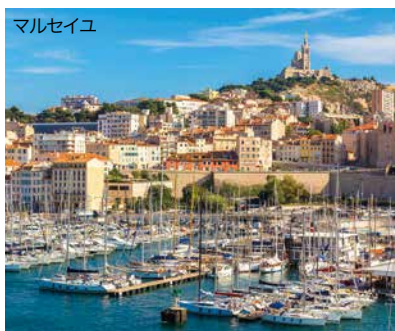
魚介スープのフィヤベスや石鱈が名物。丘の上のノートルダムドラギアルド寺院からは、海と街を360度見渡せます。