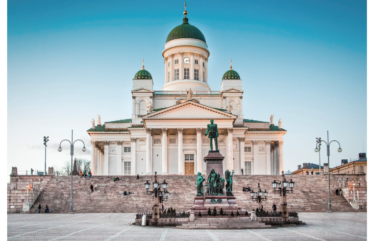
ヘルシンキ大聖堂(フィンランド) かつてスウェーデン、ロシアに支配された歴史から、それぞれの建築様式に近代的な建築が混在し、独特の雰囲気があります。【オプションツアー】