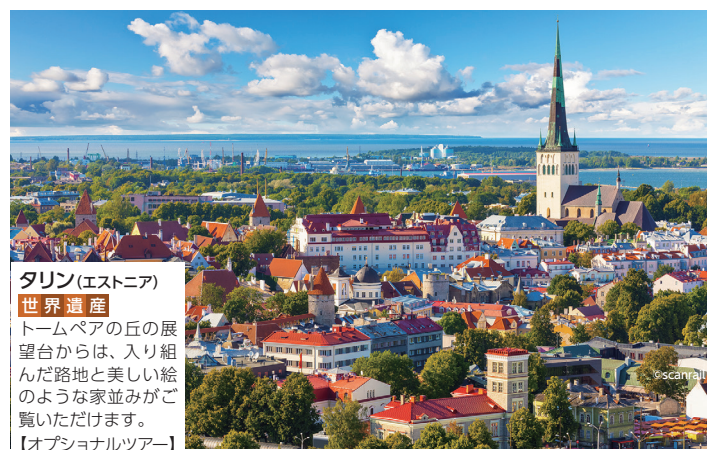
タリン(エストニア) 世界遺産 トームペアの丘の展望台からは、入り組んだ路地と美しい絵のような家並みがご覧いただけます。 【オプションツアー】