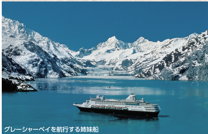
グレイシャーベイを航行する姉妹船

ホーランド アメリカ ライン ニューアムステルダム 総トン数: 86,700t 初就航: 2010年 乗客定員: 2,106名 乗組員数: 874名