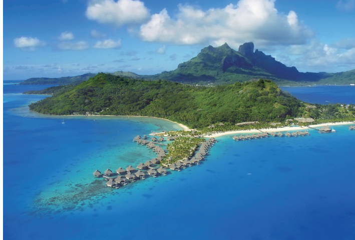
ボラボラ島(フランス領ポリネシア)

「太平洋の真珠」と称される、パレットのようなラグーンに囲まれたボラボラ島。白い砂浜の先には、カラフルな熱帯魚や巨大なマンタが優雅に泳ぐ青い海が広がります。