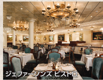
ジェファーソンズ ビストロ