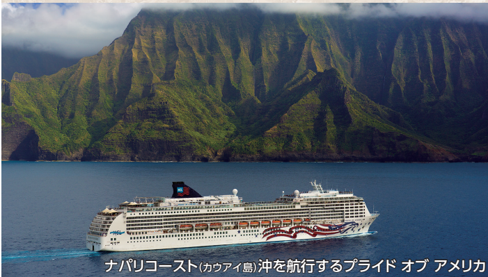
ナパリコースト(カウアイ島)沖を航行するプライド オブ アメリカ

総トン数：80,439t 初就航：2005年(2016年改装) 乗客定員：2,186名(2名様1室) 乗組員数：927名