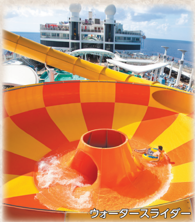
ウォータースライダー