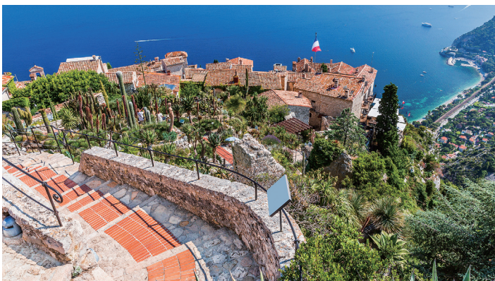
エズ村(フランス) 標高427mに位置し、高い崖を見下ろす場所にあるため「鷲の巣村」とも呼ばれる村。頂上までの小道も中世の面影が残ります。【オプションツアー】