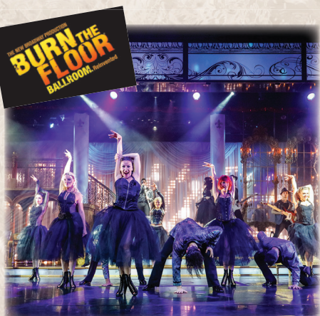
バーン・ザ・フロア

エピックシアターで楽しむバーン・ザ・フロア。日本でも人気を誇る彼らのホットなパフォーマンスを船上で。