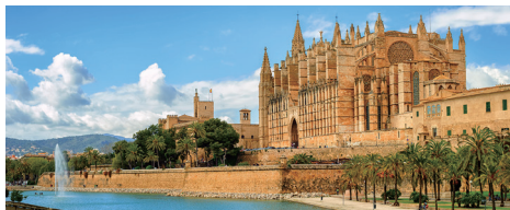
マヨルカ大聖堂(スペイン) 街の中心にある小さな塔が多い大建築物。大聖堂から路地に入るとショッピング街が広がります。 【オプションツアー】