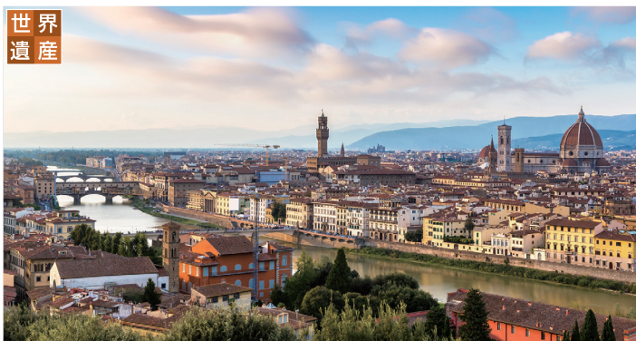
フィレンツェ(イタリア) ルネッサンス文化が花開き、今も世界中の人を魅了する花の都。シンボルのドゥオモや、シニョーリア広場は中世そのままの野外美術館のようです。【オプションツアー】