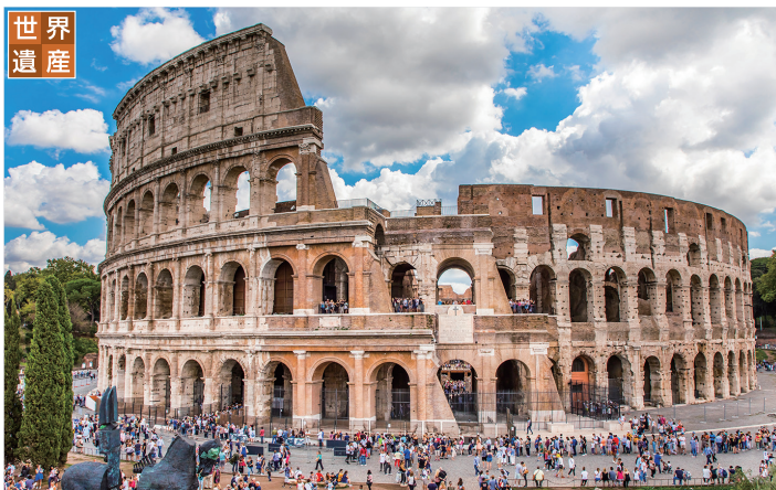
コロッセオ ローマ(イタリア) 約2000年前に建てられた円形の闘技場。周囲527m、高さ48mの大きさを誇り、収容人数は少なくとも約5万人といわれています。【オプションツアー】