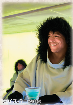
アイスバー(別料金)