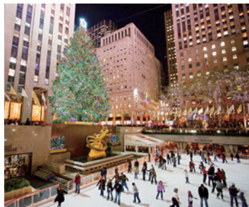
ロックフェラーセンター(ニューヨーク)

植民都市時代の堅牢な要塞と美しい建造物群 クリスマスシーズンのニューヨークへ。クリスが良好な状態で残り、「コロンビアでもっとも美しい街のひとつ」とも言われています。美しい街景のひとつ」とも言われています。