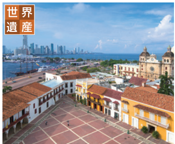
カルタヘナ(コロンビア)