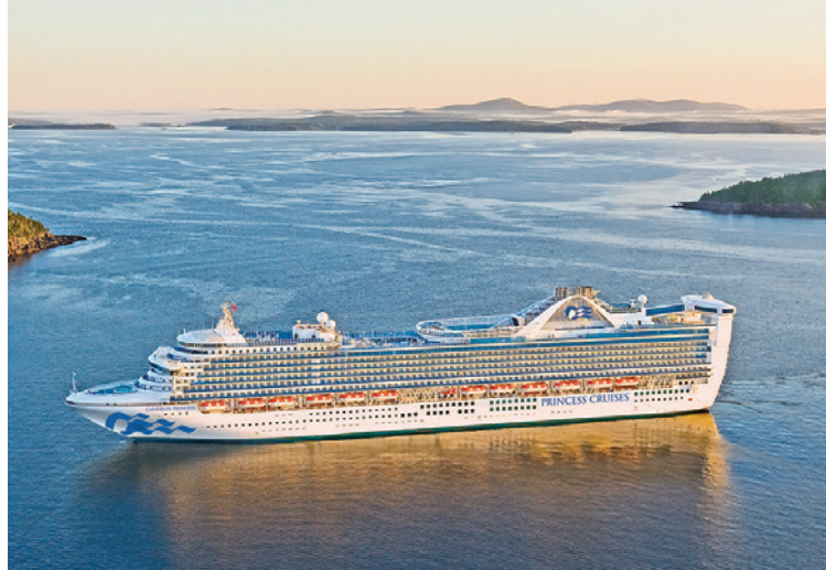
SHIP DATA [P36,37 共通]

★OP各寄港地では観光オプション(別料金)をご用意しております。詳細はお問い合わせください。 ★日程表内 ●=入場観光、◎=下車・外観観光(施設等へ入場はしません)、○=車窓観光を表します。 ★この旅行に参加いただく場合は、米国のESTA(電子渡航認証システム)に従い、認証を受ける必要があります。クルーズプラネットでは代行手数料6,000円(消費税別)にてESTA認証手続きの代行を承ります。