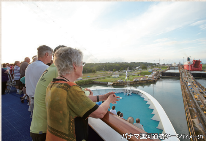
パナマ運河通航シーン(イメージ)