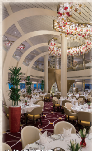
メインダイニング

270度の大大画面LEDスクリーンと立体感のあるサウンドで、臨場感あふれる体験が可能なシアター。