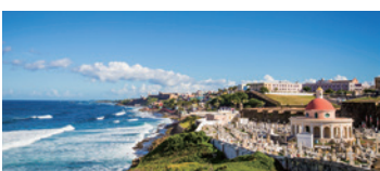
サンファン (プエルトリコ) アメリカ合衆国の自治連邦地区プエルトリコ最大の都市。世界遺産の歴史地区やパステルカラーの街並みが人気。