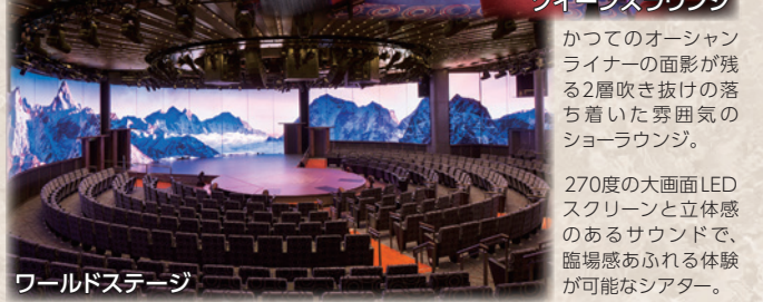
ワールドステージ

かつてのオーシャンライナーの面影が残る2層吹き抜けの落ち着いた雰囲気のあるショーラウンジ。