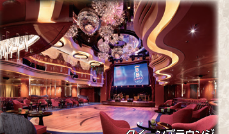
クイーンズラウンジ

かつてのオーシャンライナーの面影が残る2層吹き抜けの落ち着いた雰囲気のあるショーラウンジ。