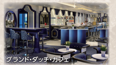
グランド・ダッチ・カフェ