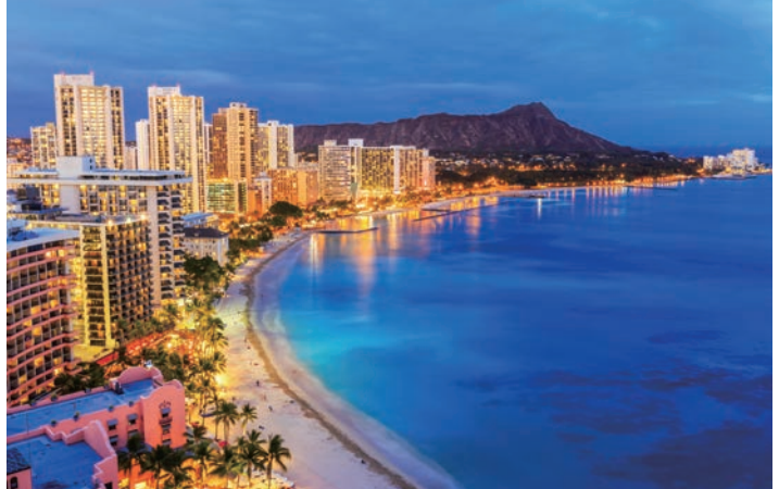
ホノルル(オアフ島) 世界的に有名なワイキキには白い砂浜の広がるビーチ、ショッピングやグルメ巡りなど、楽しみが満載です！