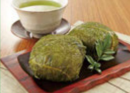
高菜でご飯を巻いた熊野名物 めはり寿司