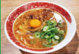
生卵のトッピングがポイント 徳島ラーメン