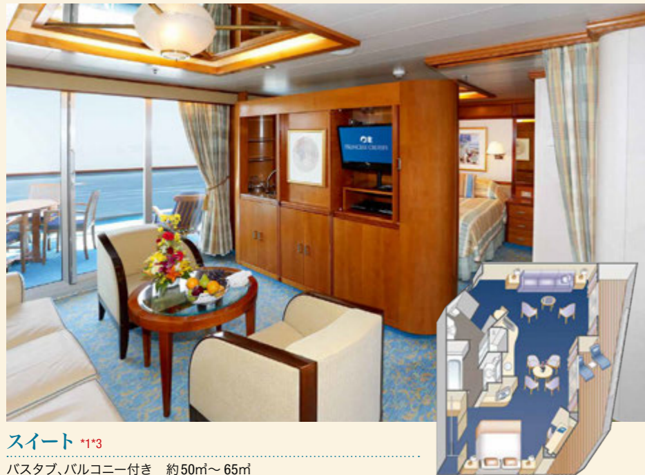
スイート *1*3 バスタブ、バルコニー付き 約50㎡～65㎡