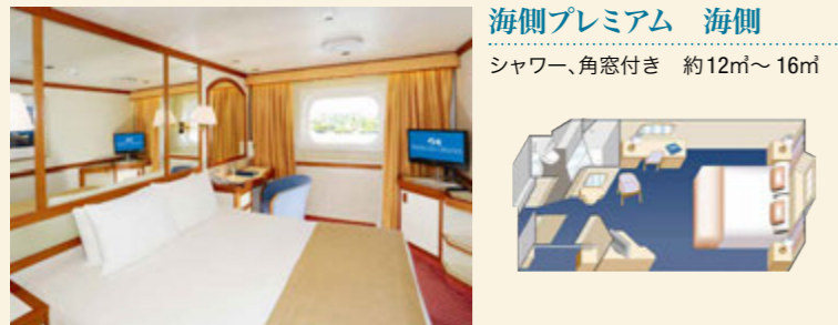
海側プレミアム 海側 シャワー、角窓付き 約12㎡～16㎡