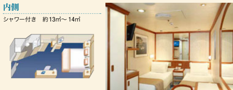
内側 シャワー付き 約13㎡～14㎡