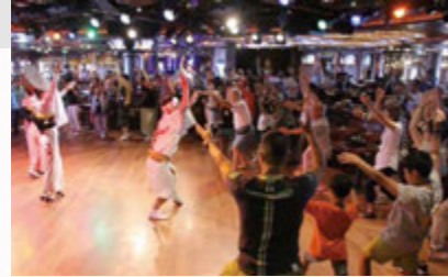
有名連から船内で阿波おどりレッスン

本場の徳島阿波おどりに踊り手としてご参加いただく体験型のオプションツアーをご用意! 本番前に船内で有名連(阿波おどりチーム)による特別レッスンもあるので、初めてでも安心! お気軽にご参加できます。