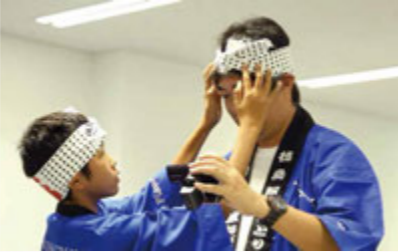
男性用・女性用・お子さま用の衣装をご用意