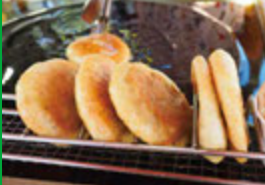
釜山へ行ったら屋台スイーツ ホットク