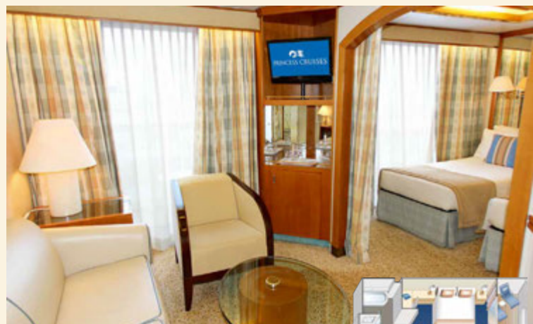
プレミアム・ジュニア・スイート *1 プレミアム・ジュニア・スイート(船尾) *1*3 ジュニア・スイート *1*2 バスタブ、バルコニー付き 約34㎡～37㎡