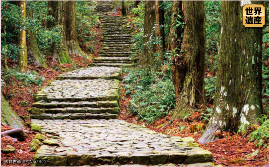
熊野古道 ※オプションツアー