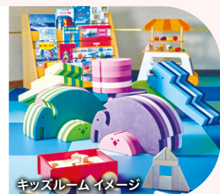
キッズルームイメージ