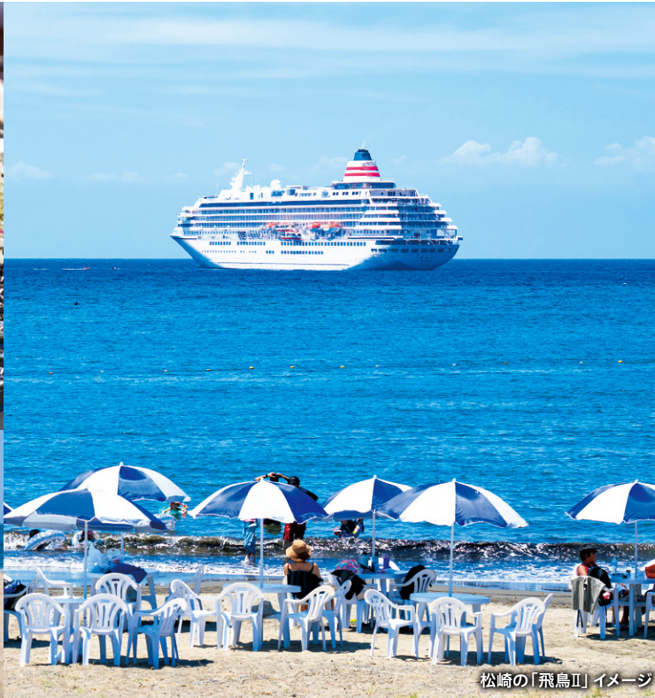
松崎の「飛鳥II」イメージ