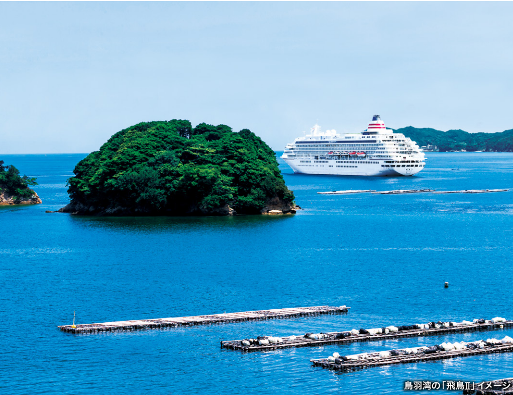
鳥羽湾の「飛鳥II」イメージ