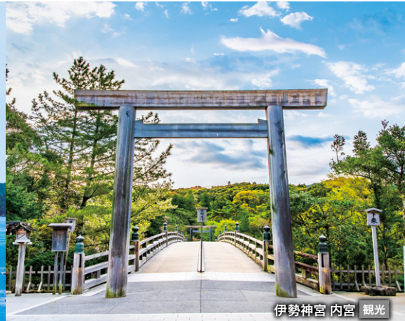
伊勢神宮 内宮 観光