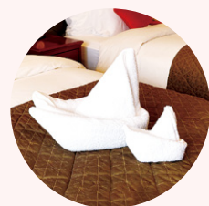
職業体験一例 タオルアートイメージ

ウェ이터やイベントの司会者など、「飛鳥II」の仕事体験してみましょ。好きなこと、気になるお仕事があればぜひチャレンジを!ここでしかできない経験は素敵な思い出になるはず。 ※職業体験の内容は変更となる場合がございます。