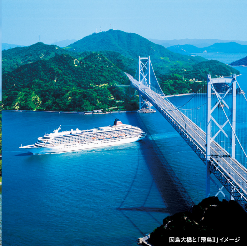
因島大橋と「飛鳥II」イメージ