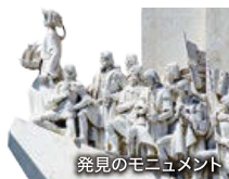
発見のモニュメント