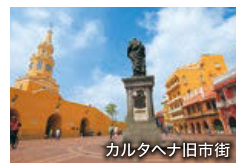
カルタヘナ旧市街

16世紀にスペインによって築かれ、金や銀、宝石などの貿易で栄えた古都。石の城壁に囲まれた旧市街には当時のままコロニアル様式のカラフルな街並みが広がり、世界遺産に登録されています。