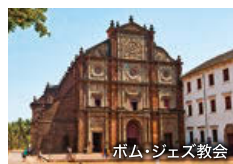
ボム・ジェズ教会

インド西海岸の美しいビーチリゾート。ポルトガル統治時代の面影が残り、フランシスコ・ザビエルの聖遺物が納められているボム・ジェズ教会などの文化遺産も見どころです。