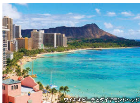
ワイキキビーチとダイヤモンドヘッド