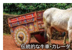
伝統的な牛車・カレータ

国土の4分の1が国立公園に指定されているコスタリカは、エコツアーリズム先進国。熱帯の植物園ではネイチャーツアーが開催され、ゴンドラで熱帯雨林を遊覧することもできます。高原都市サン・ホセへの観光もおすすめです。