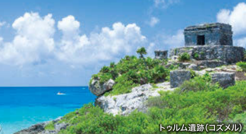
トゥウム遺跡(コズメル)