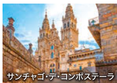
サンチャゴ・デ・コンポステーラ