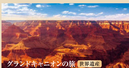
グランドキャニオンの旅 世界遺産