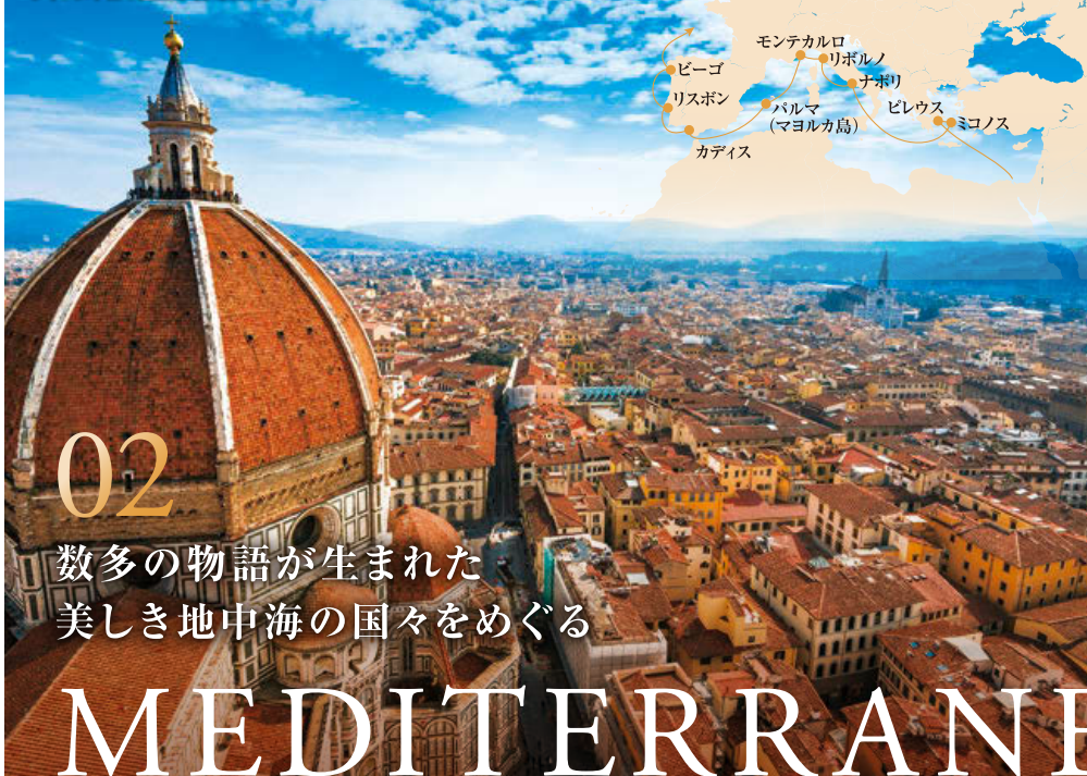
フィレンツェの街並み(リボルノ)