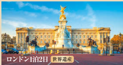
ロンドン1泊2日 世界遺産