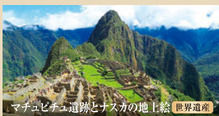
マチュピチュ遺跡とナスカの地上絵 世界遺産