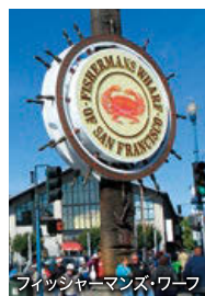
フィッシャーマンズ・ワーフ

赤い橋ゴールデンゲートブリッジがシンボルの風光明媚な街で、坂が多い市街では路面電車が走ります。フィッシャーマンズ・ワーフなどの名所のほか、カリフォルニアワインの産地ナパバレーへも訪れていただけます。