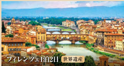
フィレンツェ1泊2日 世界遺産