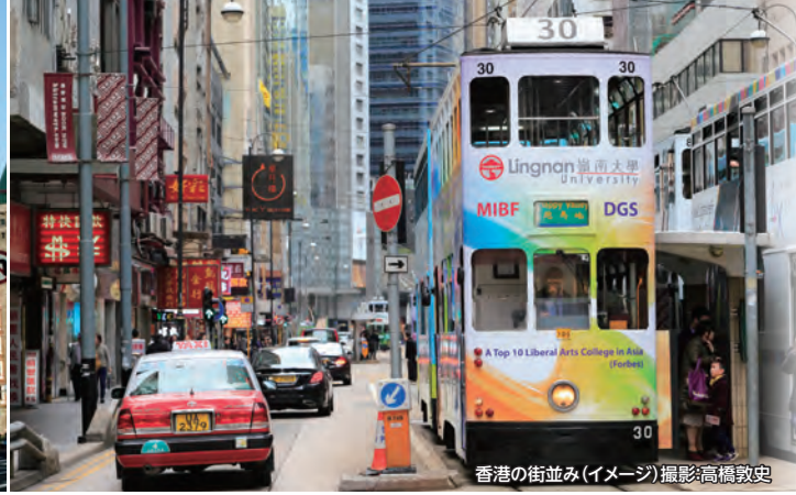
香港の街並み(イメージ)