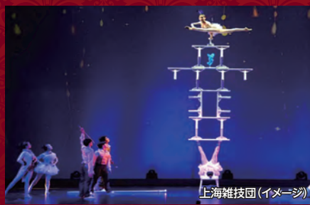
上海雑技団(イメージ)

※不参加もしくは万一、催行中止の場合でも他オプションツアーへの振替や相当額の補償はありません。