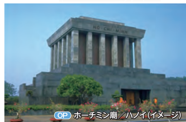
OP ホーチミン廟/ハノイ(イメージ)