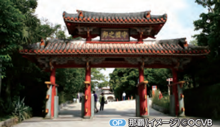
OP 那覇(イメージ)