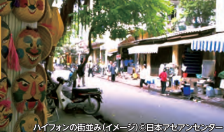
ハイフオンの街並み(イメージ)