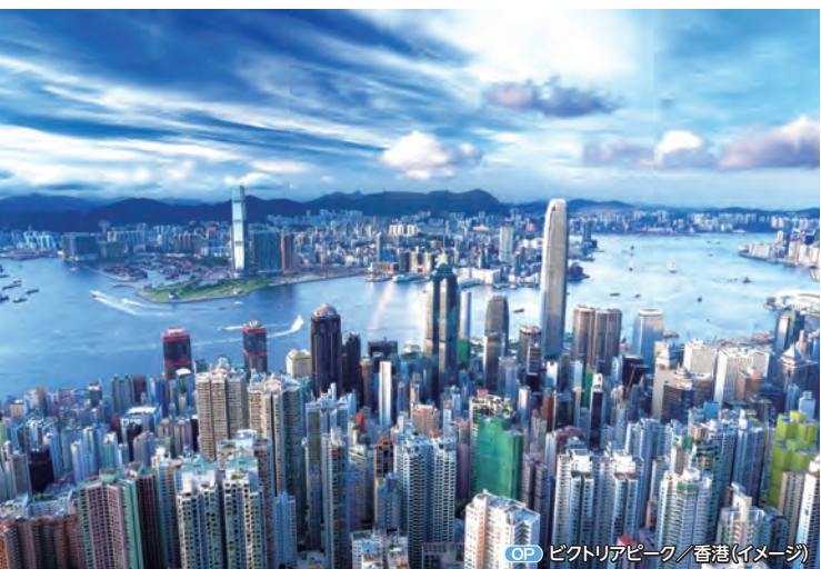
OP ビクトリアピーク/香港(イメージ)