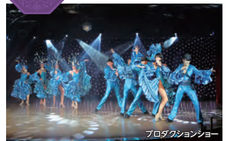
プロダクションショー