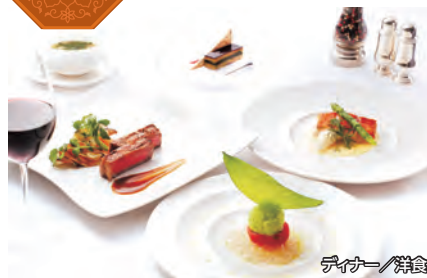
ティータイム/軽食