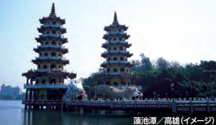
蓮池潭 / 高雄(イメージ)