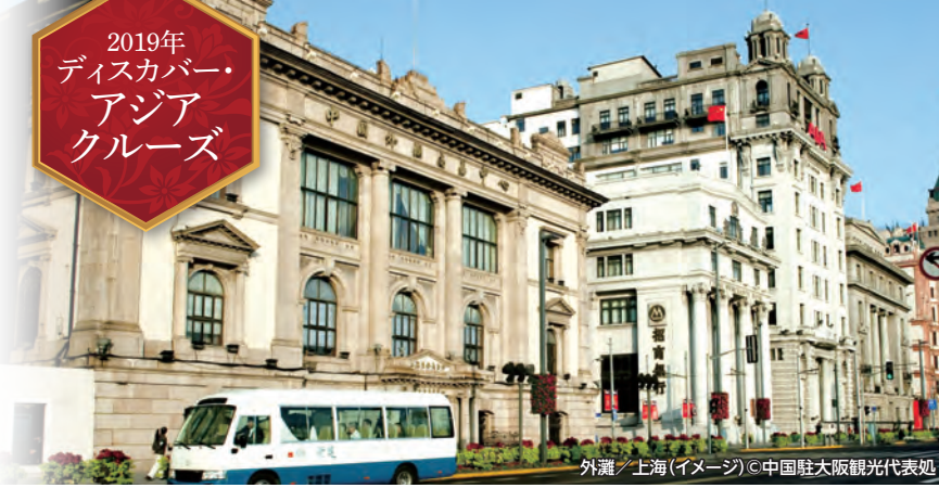
外灘/上海(イメージ)