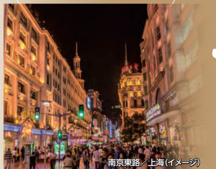
南京東路/上海(イメージ)