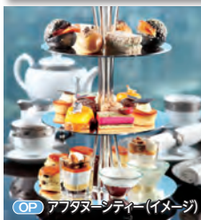
OP アフタヌーンティー(イメージ)