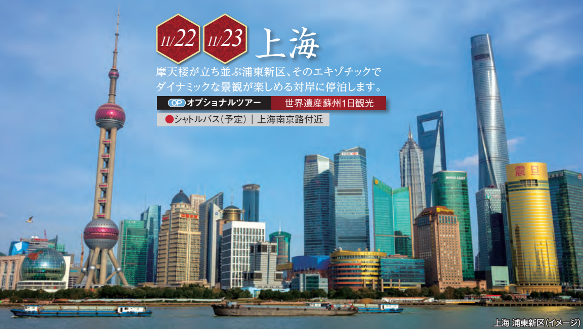
上海 浦東新区(イメージ)