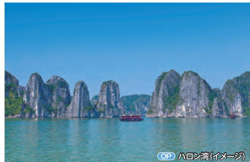
OP ハロン湾(イメージ)