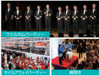
ウェルカムパーティー