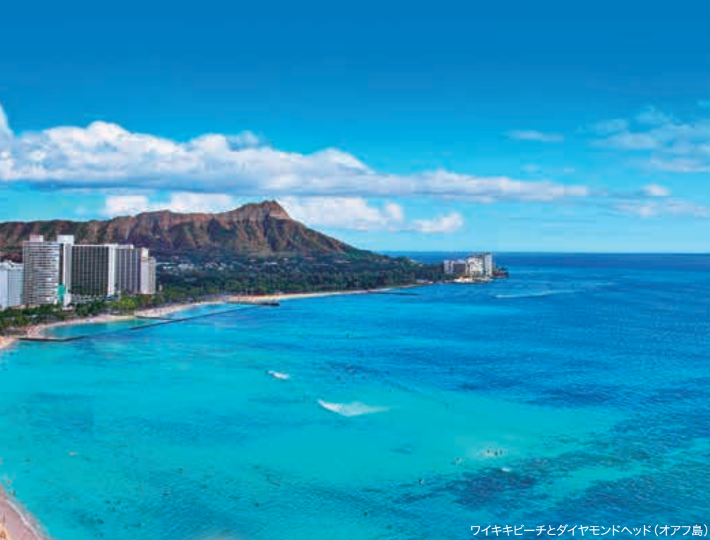
ワイキキビーチとダイヤモンドヘッド(オアフ島)