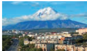
アバチャ火山と市街

標高4,750メートルのクリュチェフスカヤ火山をはじめ、大小およそ30の活火山が連なるカムチャッカ地方の首府です。