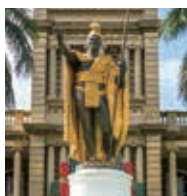
カメハメハ大王像

林立する高層ホテルと白 砂のワイキキビーチ、その 奥にダイヤモンドヘッドを 望む風景には、ホノルルの 魅力が凝縮されています。 華やかな「都会」と、楽園 たる「大自然」の共存する 人気のリゾート地です。