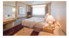
角窓 (バルコニーなし) 18.4m 2