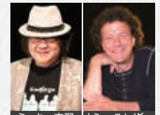
ミッキー吉野 トミー・スナイダー

ドラマー。1977年に来日しゴダイゴに参加。2010年に通算7枚目のソロ・アルバムをリリース。