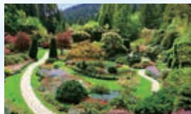
ブッチャート・ガーデン

港沿いに遊歩道 が延び、州議事 堂やロイヤル・ プリティッシュ コロニア博物 館などの見ど ころが集まるイン ナー・ハーバーが街の顔です。四季折々の花が咲 き誇るブッチャート・ガーデンは必見です。