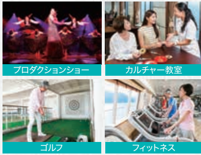
プロダクションショー