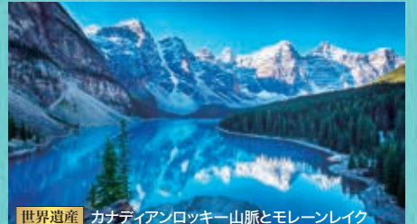
世界遺産 カナディアンロッキー山脈とモレーンレイク

常夏のハワイから空路でカナダへ。人気のモレーンレイクとレイクルーズを含む二つの国立公園ほか、コロンビア大氷原などを訪れます。カナディアンロッキーの麓、真っ青な湖が神秘的です。大陸横断鉄道の乗車も楽しめます。