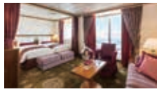
バルコニー付 45.8m 2