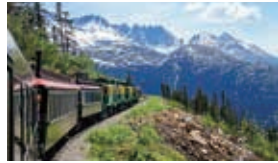
ホワイトバス・ユーコン鉄道

入り組んだ海岸線インサイド・パッセージの最奥に位置する港町。ゴールドラッシュ時代の面影を色濃く残しています。深い峡谷を標高873メートルまで登ります。鉱山鉄道ホワイトバス・ユーコン鉄道の起点です。