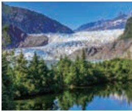
メンデンホール氷河

アラスカ州の州都で巨大なメンデンホール氷河が近郊にあり、遊覧飛行や犬ぞり氷原散策など、ダイナミックな氷河体験ができます。