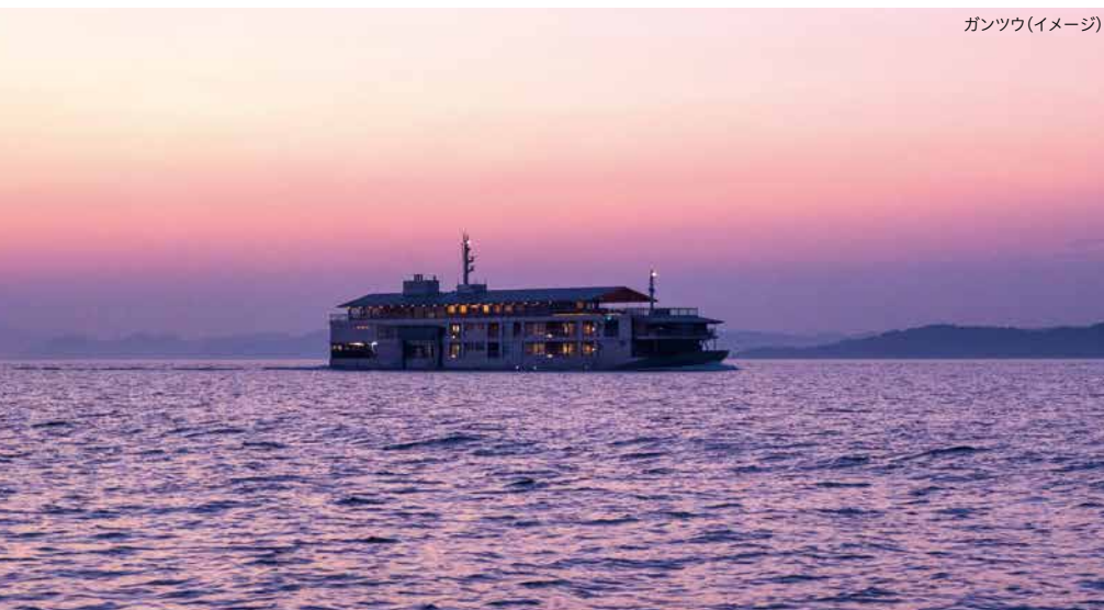
ガンツウ(イメージ)