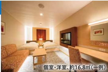
個室・洋室、約16.8㎡(一例)