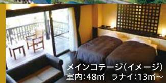
メインコテージ(イメージ) 室内:48㎡ ラナイ:13㎡