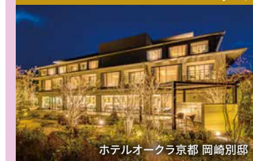
ホテルオークラ京都 岡崎別邸

2022年1月開業。「ホテルオークラ」ブランド、初のスモールラグジュアリーホテル