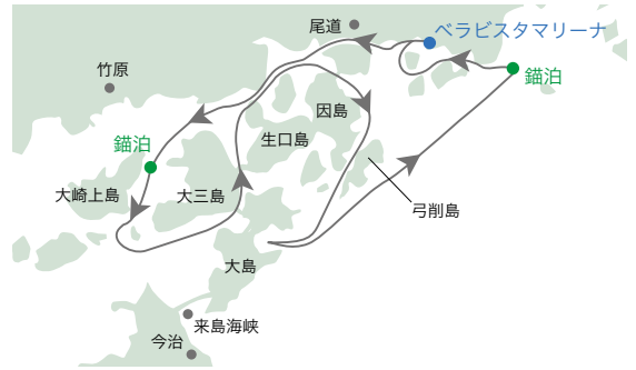
※気象・海象状況により当日の航路が予告なく変更となる場合がございます。