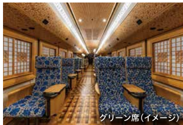
グリーン席(イメージ)