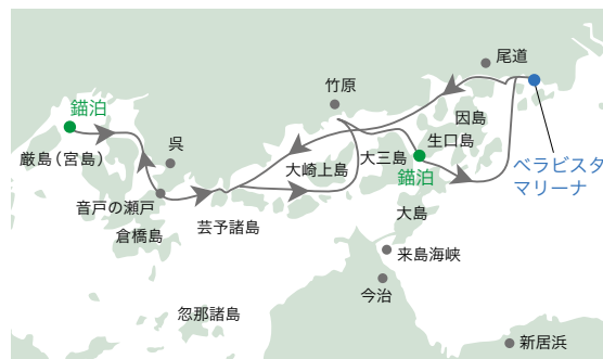
※気象・海象状況により当日の航路が予告なく変更となる場合がございます。