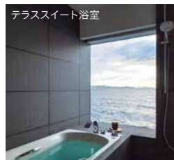
テラススイート浴室

ガンツウの客室は、全室瀬戸内海を一望できるテラス付きのスイート。海側に配されたガラス張りの浴室では、天候や時間帯に左右されず、海と一体となる感覚でバスタイムをお楽しみください。