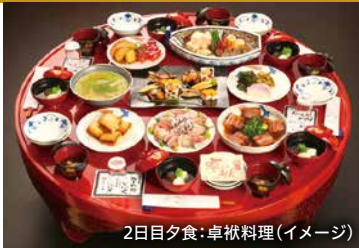
2日目夕食:卓袱料理(イメージ)