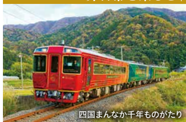
四国まんなか千年ものがたり