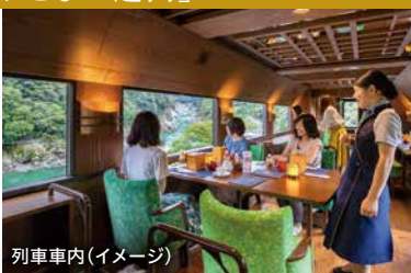
列車車内(イメージ)