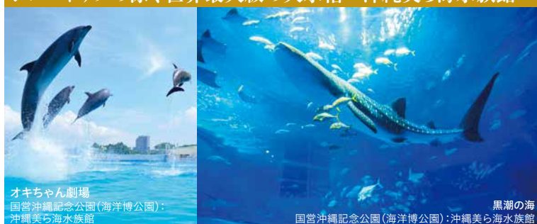
オキちゃん劇場 国営沖縄記念公園(海洋博公園): 沖縄美ら海水族館