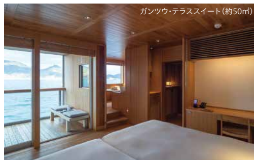
ガンツウ・テラススイート(約50㎡)