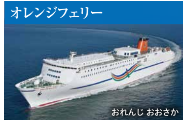
おれんじ おおさか