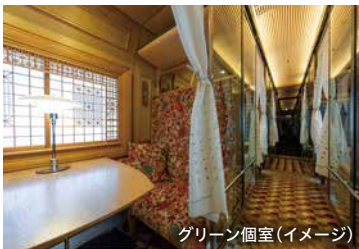
グリーン個室(イメージ)

■旅行代金(大人お1名様/2名様1室利用)( )内は1人部屋追加代金 (単位:円)