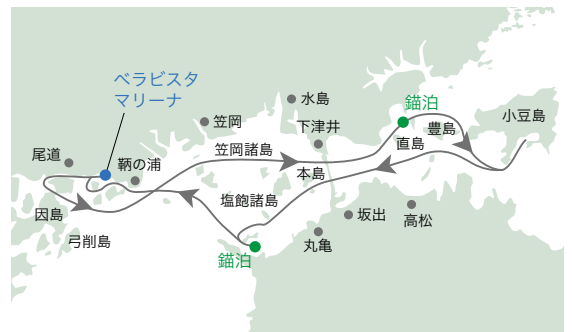
※気象・海象状況により当日の航路が予告なく変更となる場合がございます。

旅行企画・実施 *株式会社せとうちクルーズの旅行条件書をご確認の上、お申込みください。