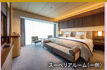
スーペリアルーム(一例)