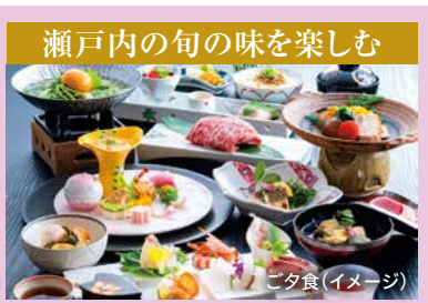
瀬戸内の旬の味を楽しむ