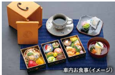
車内お食事(イメージ)