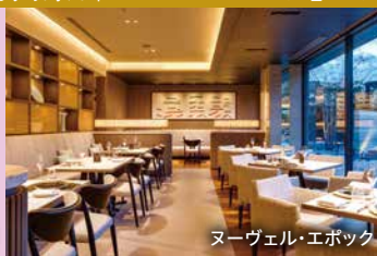
ヌーヴェル・エポック