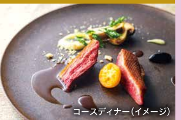
コースディナー(イメージ)

ホテルオークラ京都 岡崎別邸 銀閣寺・南禅寺・平安神宮・京都国立近代美術館など歴史的観光名所や美術館が集まった文化的エリア、京都岡崎に2022年1月オープン。客室は、約40㎡。部屋の窓から日本庭園を望むことができる、ガーデンルームも選択可能です。レストラン「ヌーヴェル・エポック」では、1日目コースディナーをご用意。京都の食文化とオークラフレンチが融合した新しい一皿をお届けします。