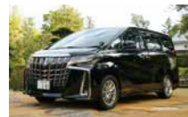
1日目は観光後、ホテルまで専用車で(イメージ)

2022年1月開業。「ホテルオークラ」ブランド、初のスモールラグジュアリーホテル