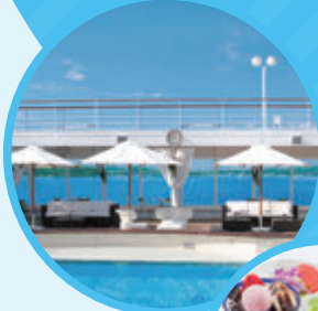
シーホースプール (イメージ)

※1 子供代金(2歳以上12歳以下、小学生まで)が40,000円となります。 ※2 ご乗船後、夕食時にお申し付けください。 ※3 ツアー代金不要の観光ツアーです。