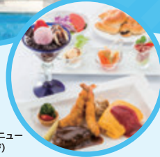
キッズメニュー (イメージ)