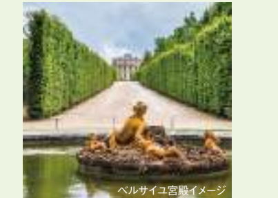
ベルサイユ宮殿イメージ

花の都パリを発着地とするクルーズ。印象派絵画の巨匠、ゴッホ、セザンヌ、そしてゴーギャンの軌跡をパリからセーヌ川下流のルーアン、続いてノルマンディー地方のコドゥベック＝アン＝コーへと辿ります。第二次大戦中のノルマンディー上陸作戦で有名なビーチを訪れるエクスカーションもご紹介します。