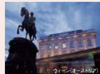
ウィーン(オーストリア)

1年の終わりと、新年を祝うクルーズです。大晦日には、クルーズのハイライトとなる船上のシルベスター(大晦日)ガラが催されます。そして、人々が街に繰り出し、時計台が新年の0時を知らせるのを待つ中、アマデウスの船のサンデッキから街のまばゆい光を眺め、ワルツを踊りながら新年を迎えます。