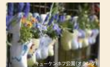
キューケンホフ公園(オランダ)

アムステルダム、ゲント、アントワープなど、絵画のように美しい場所を訪れるクルーズです。特殊な水路に沿って、世界で最も美しいとされる壮大なチューリップ畑や有名な園芸を訪問します。オランダの南部に位置するキューケンホフ公園は、ヨーロッパ最大の花園で、春には世界でいちばん美しいと言われる「ヨーロッパの庭園」です。チューリップや水仙、ヒヤシンスなど700万本以上の花が咲き誇る、この時期にしか見ることのできない景観をぜひご覧ください。