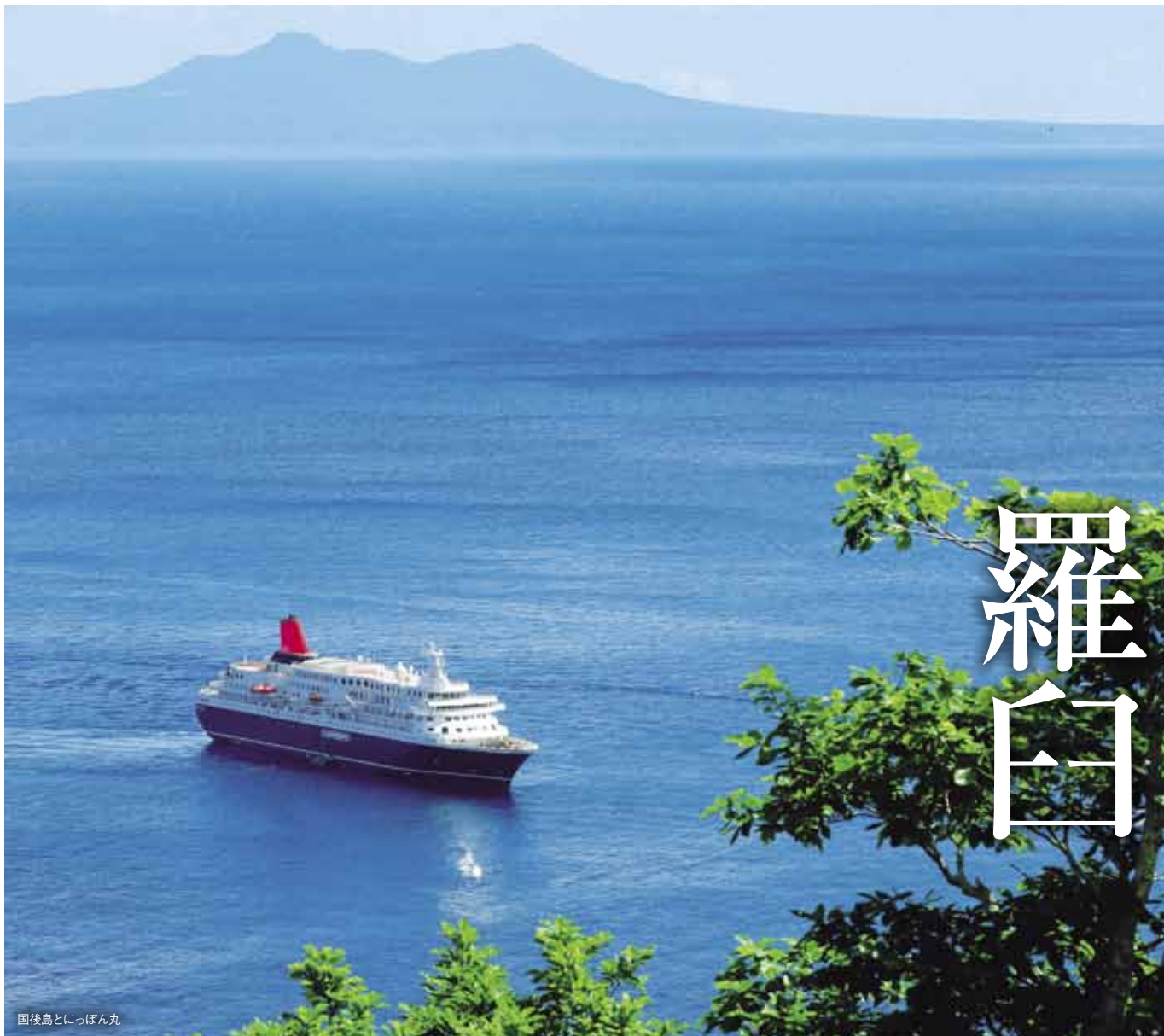
国後島とっぽん丸