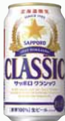
サッポロクラシック (イメージ)