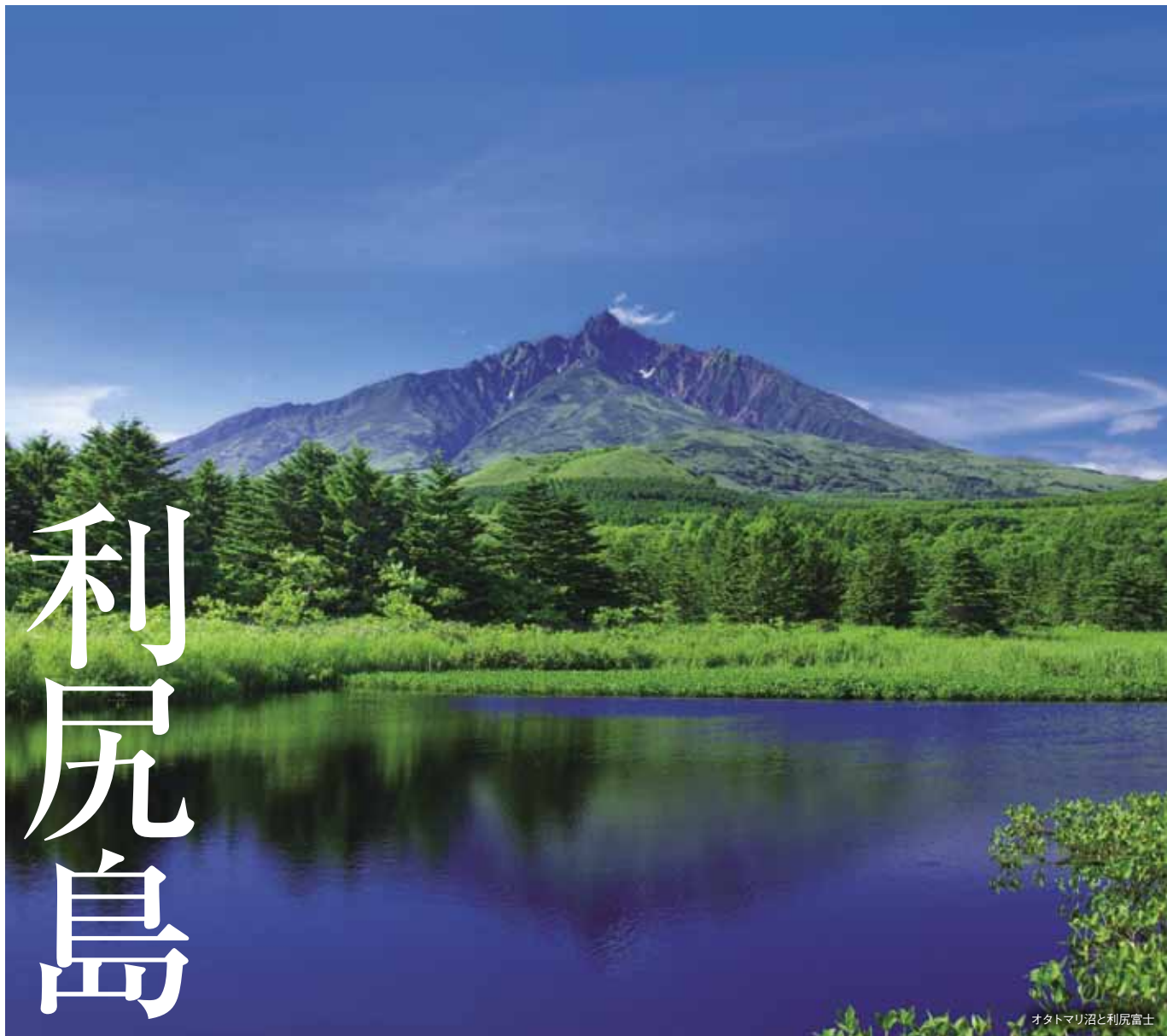
オタマリ沼と利尻富士