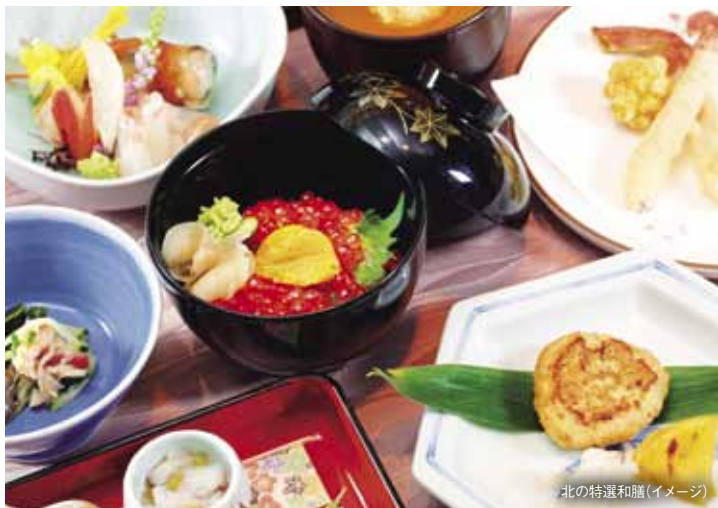
北の特選和膳(イメージ)

にっぽん丸総料理長が腕をふるい、海の幸はもちろん、北海道産大豆で作られたお豆腐「豆太」など北の大地の恵みもふんだんに使用した「北の特選和膳」をご用意いたします。(クルーズ中1回)