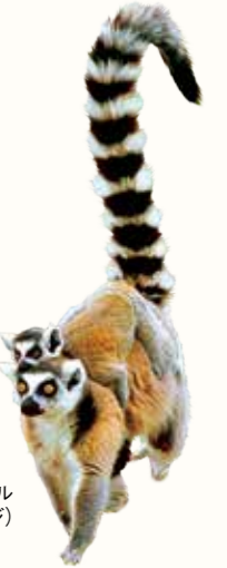
ワオキツネザル(イメージ)

アフリカ大陸の南東沖に浮かび、世界で4番目の大きさを誇る島国。約6500万年前、南半球に存在したゴンドワナ大陸がアフリカ大陸とインドに分裂した際に生まれたという説があります。そのため自然環境が隔絶され、動植物が独自の生態系を維持。ワオキツネザルを始めとする野生動物の70~80%が固有種といわれています。今回は、別名タマタヴとも呼ばれるマダガスカル島の東部の港町トゥアマシナに初寄港します。