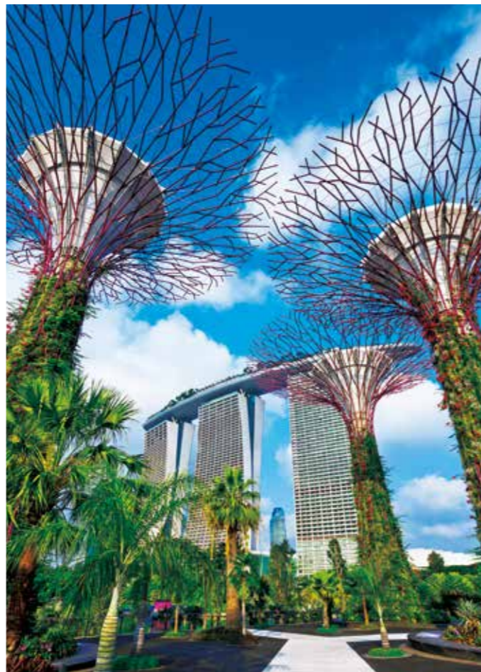
ガーデンズ・バイ・ザ・ベイ

【復路】マリーナ・ベイ・サンズ展望台と ローカルグルメの昼食 ナイトサファリ観光