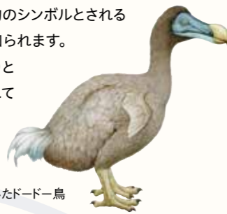
絶滅したドーダー鳥

「インド洋の貴婦人」。そう称されてきたモーリシャスは、東京都とほぼ同じ面積の中に、白砂のビーチや世界遺産のル・モーン山、高原地帯などを抱える美しい島国で、絶滅動物のシンボルとされる大鳥ドーダーがかつて存在していたことでも知られます。今回は3泊4日の滞在で、時間を忘れてたっぷりモーリシャスの自然、文化、人々の魅力に触れていただけます。