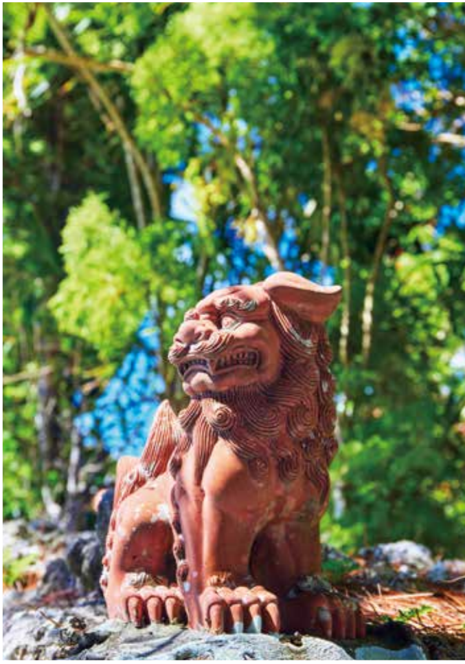
シーサー(イメージ)