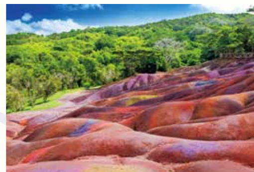
シャマレル 七色の大地