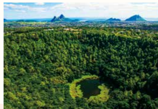
キュールピップ トゥル・オ・セルフ