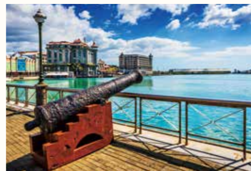
ポートレイス ウォーターフロント