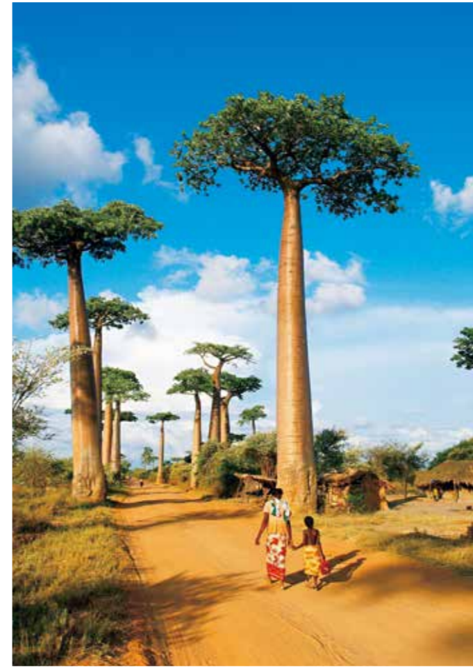
ムルンダヴァのバオバブの木