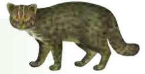
イリオモテヤマネコ (イメージ)