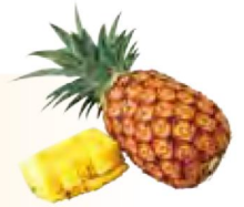
パイナップル (イメージ)