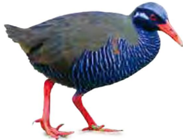
ヤンバルクイナ (イメージ)