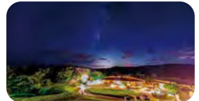
やんばる学びの森 (イメージ)