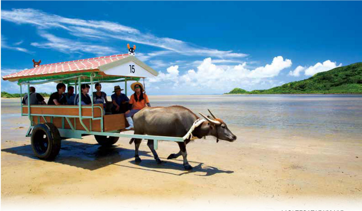
由布島と西表島の間を行き交う水牛車