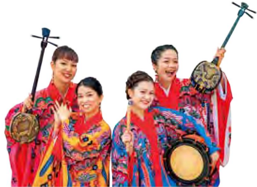
沖縄民謡ユニット「いなぐんぐわ」