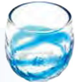
琉球ガラス (イメージ)