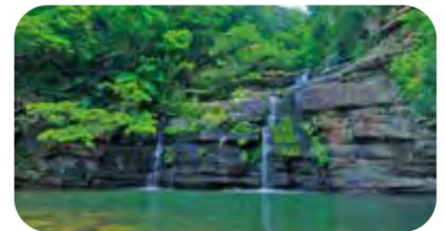
西表島・水落の滝