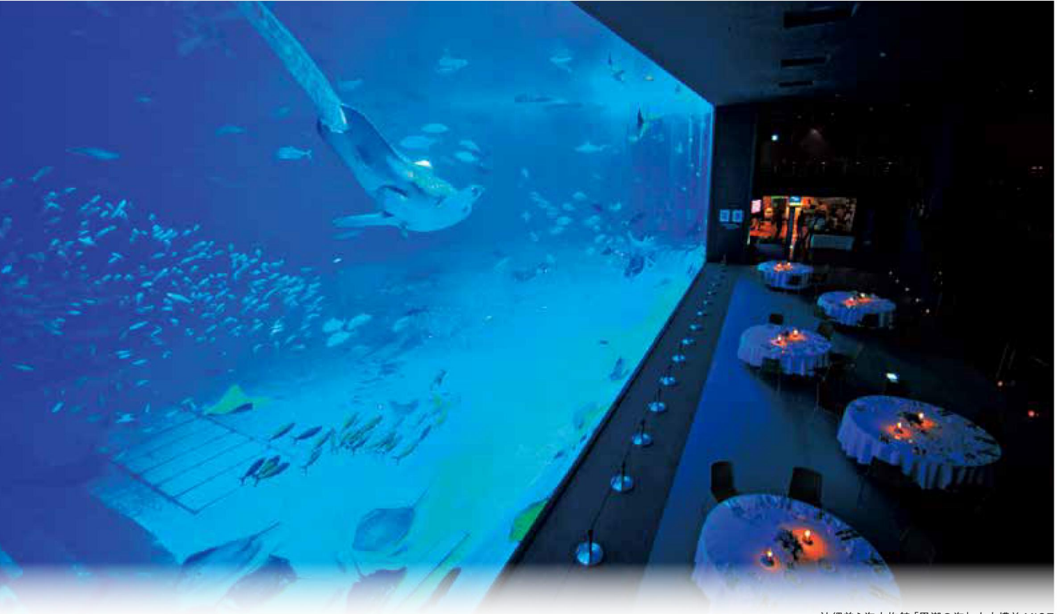
沖縄美ら海水族館「黒潮の海」大水槽前 MICE