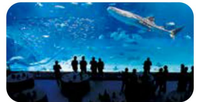
沖縄美ら海水族館「黒潮の海」大水槽前 MICE