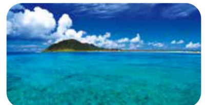
野甫大橋からの眺め