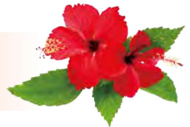
ハイビスカス (イメージ)