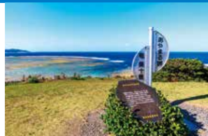
あやまる岬観光公園