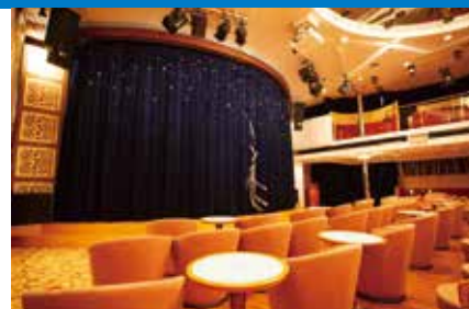
ドルフィンホール

2023年2月14日(火) 横浜発 &gt;&gt;&gt; 2月16日(木) 横浜着 3日間