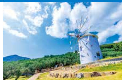
小豆島オーリーブ公園