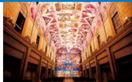
システィーナ・ホール：大塚国際美術館 陶板名画

2022年12月11日 名古屋発 &gt;&gt;&gt; 12月13日 名古屋着 3日間