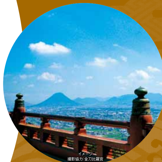
イメージ

象頭山の中腹に位置し、海の神様「大物主神」と崇徳天皇を祀る金刀比羅神社の総本宮です。美しい建築物や美術品が残り、見どころが数多くあります。