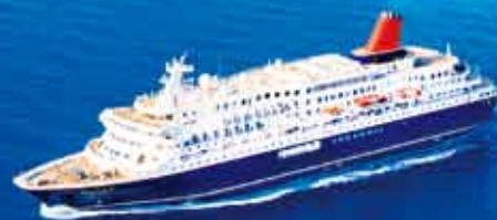
瀬戸内海(イメージ)