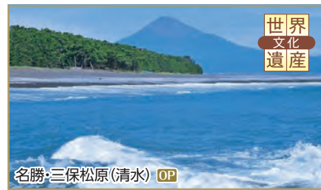
名勝・三保松原(清水) OP