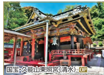
国宝・久能山東照宮(清水) OP

OP 日本平 夢テラスと 久能山東照宮 ◆所要時間: 約3.5時間 ◆お食事:なし