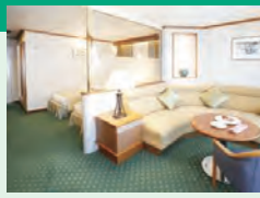
定員2名(35㎡ 10階、バス・トイレ・バルコニー付)

※ブルーレイプレーヤー付 ※スイートBは、救命ボートによりベランダの眺望が妨げられます。