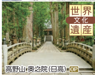
高野山・奥之院(日高) OP