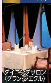
ダイニングサロン (グランシエクル)