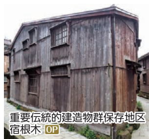
重要伝統的建造物群保存地区 宿根木 OP

佐渡島 ●千石船と船大工の里・宿根木散策 ●日本最大の金鉱山「佐渡金山」とたらい舟体験