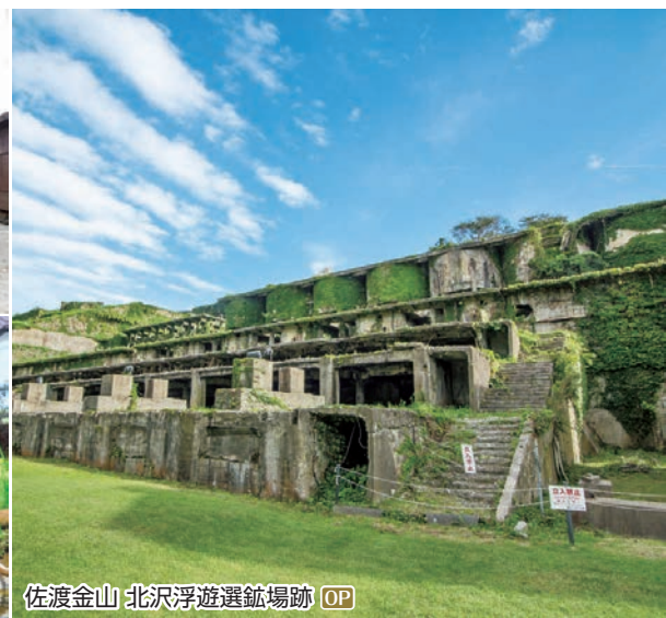
佐渡金山 北沢浮遊選鉱場跡 OP