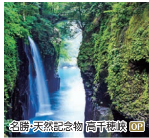
名勝・天然記念物 高千穂峡 OP