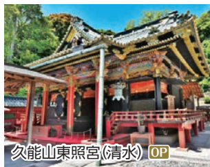
久能山東照宮(清水) OP

日高 ●動物たちとの出会いがいっぱい!アドベンチャーワールドの旅 清水 ●世界遺産 三保松原と東海道広重美術館