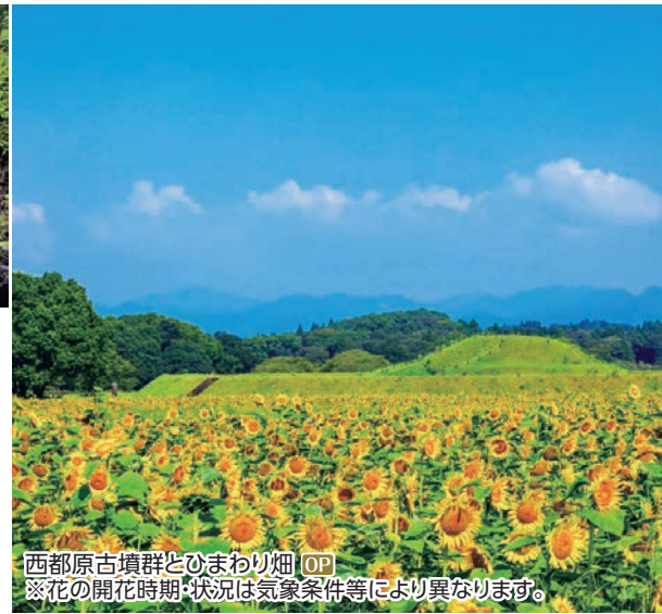
西都原古墳群とひまわり畑 OP ※花の開花時期・状況は気象条件等により異なります。