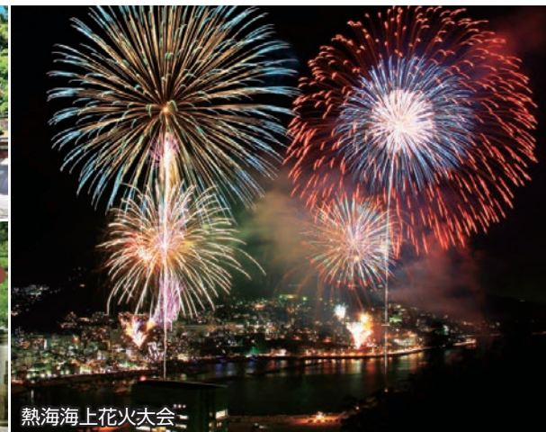
熱海海上花火大会

ご旅行代金 (おとなおひとり様・単位 / 円・消費税込) ( )は子供代金(2歳以上小学生以下)