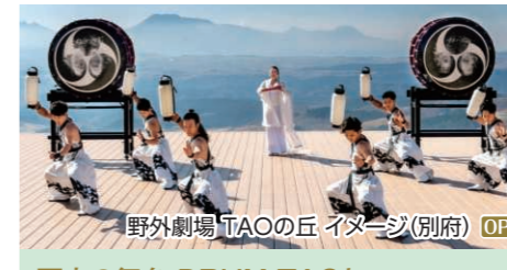
野外劇場TAOの丘 イタージ(別府) OP

別府を一望!天空展望台とべっぴん地獄めぐり 血の池地獄・龍巻地獄、海地獄、 グローバルタワー ◆所要時間:約3.5時間 ◆お食事:なし