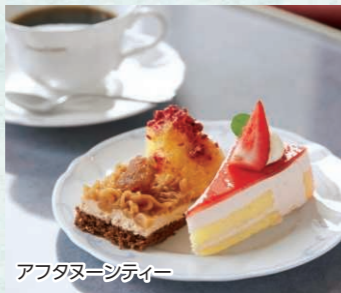
アフタヌーンティー