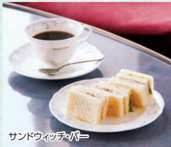
サンドウィッチ・バー