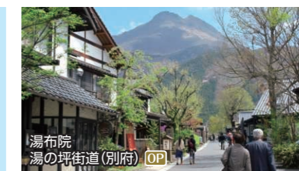
湯布院 湯の坪街道(別府) OP

桂浜行 送迎バス 半日プラン 桂浜(自由行動) ◆所要時間:約2時間 ◆お食事:なし