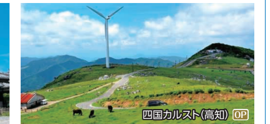
四国カルスト(高知) OP

屋根船から見る仁淀川と高知城・桂浜 仁淀川屋根船遊覧船、名越屋沈下橋(写真停車)、 高知城、桂浜、坂本龍馬像 ◆所要時間:約6時間 ◆お食事:昼食付