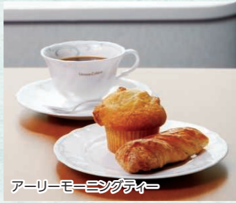
アーリーモーニングティー