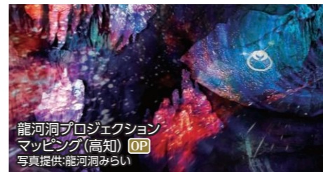
龍河洞プロジェクト マッピング(高知) OP

音と光が融合する龍河洞 龍河洞、西島園芸団地 ◆所要時間:約3.5時間 ◆お食事:なし