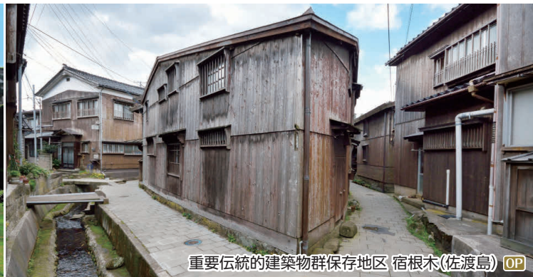
重要伝統的建築物群保存地区 宿根木(佐渡島) OP