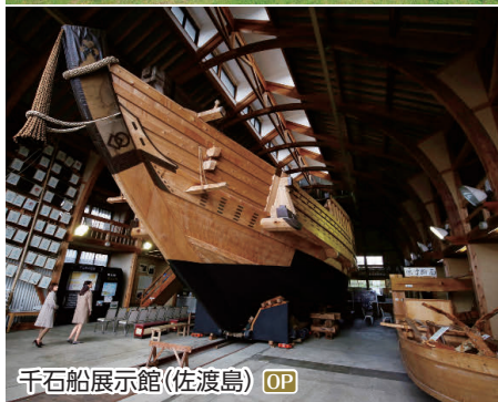
千石船展示館(佐渡島) OP