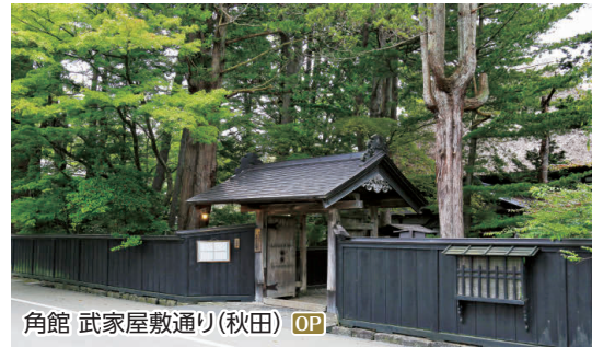
角館 武家屋敷通り(秋田) OP