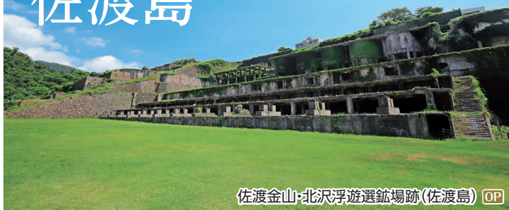
佐渡金山・北沢浮遊選鉱場跡(佐渡島) OP