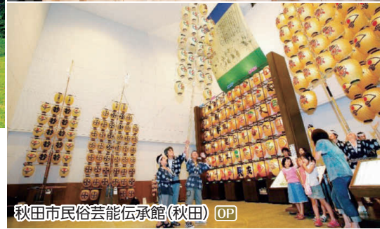
秋田市民俗芸能伝承館(秋田) OP