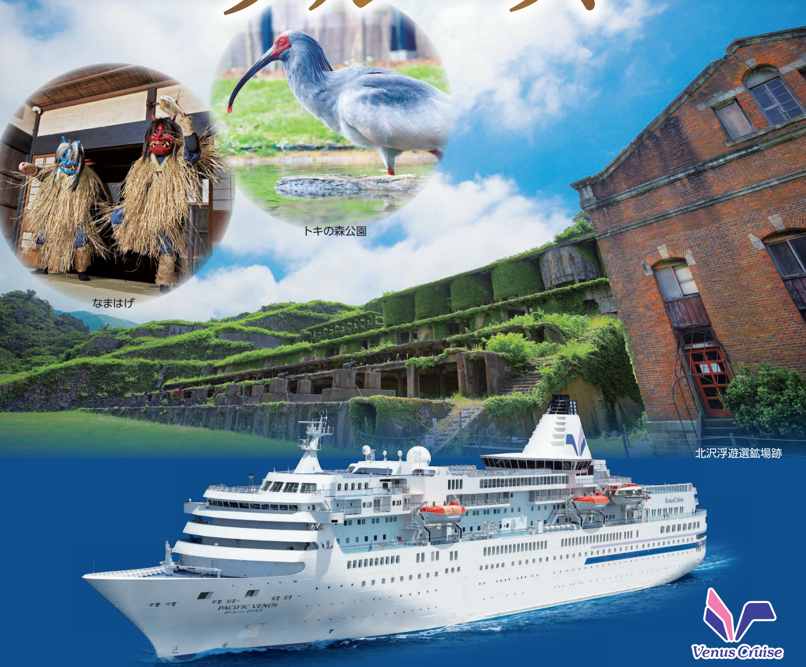
北沢浮遊選鉱場跡