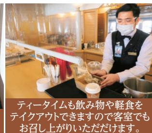
ティータイムも飲み物や軽食をテイクアウトできますので客室でもお召上がりいただけます。