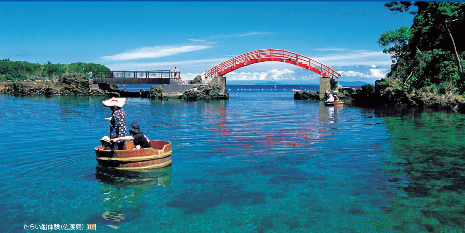
たらい船体験(佐渡島) OP