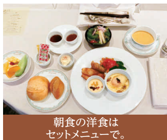
朝食の洋食はセットメニューで。

変わらない美味しさにより安心と安全を添えてお食事・ティータイムなどビュッフェを取り止め、スタッフが取り分けてご提供します。