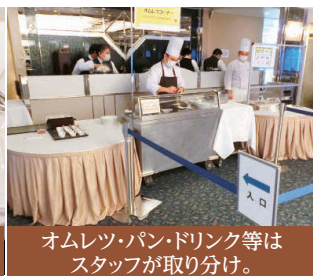
オムレツ・パン・ドリンク等はスタッフが取り分け。