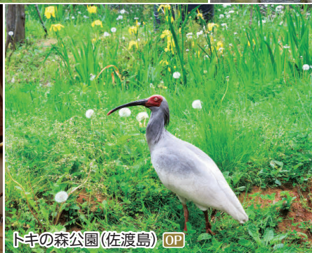
トキの森公園(佐渡島) OP