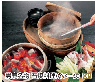
男鹿名物 石焼料理(イヌーダ) OP

お湯をはった秋田杉桶に新鮮な魚介を投入し約800℃の石で瞬間的加熱する「目で、耳で、舌で楽しむ男鹿の名物料理」です。