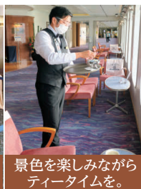
景色を楽しみながらティータイムを。