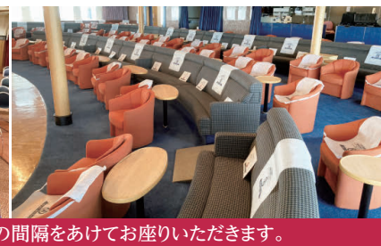
メインホール・メインラウンジは席の間隔をあけてお座りいただけます。