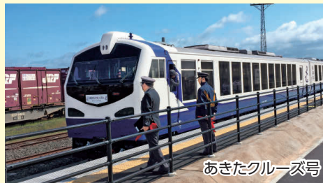
あきたクルーズ号