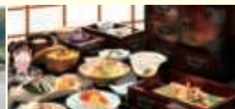
仙台筆筒料理(石巻)(イメージ) OP

仙台筆筒料理 仙台伝統工芸の一つ、仙台筆筒を縮小した美しい器に盛り付けた料理です。