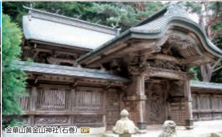
金華山黄金山神社(石巻) OP