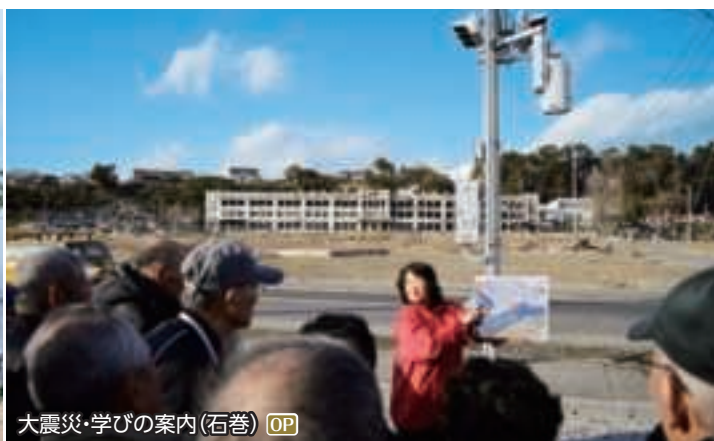
大震災・学びの案内(石巻) OP