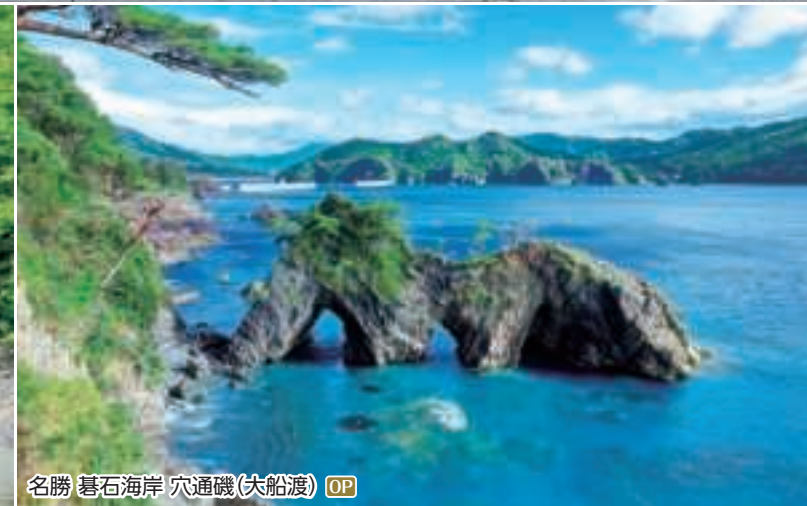
名勝 碓石海岸 穴通磯(大船渡) OP