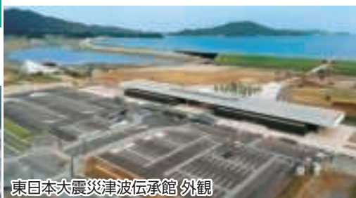
東日本大震災津波伝承館 外観