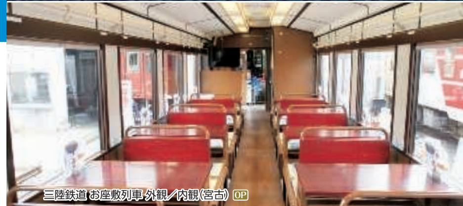
三陸鉄道「お座敷列車」外観/内観(宮古) OP