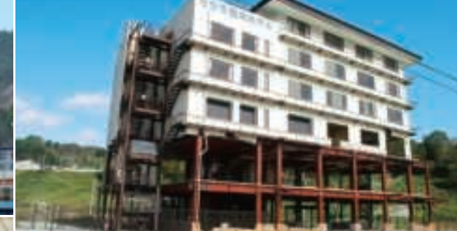
震災遺構 たろう観光ホテル(宮古) OP