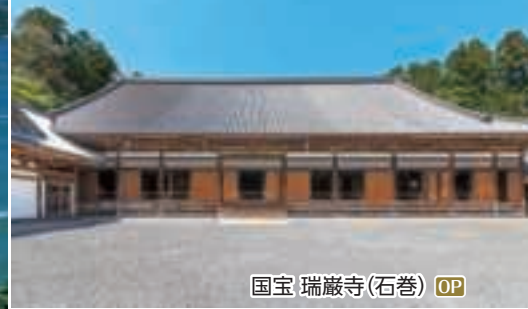
国宝 瑞巖寺(石巻) OP