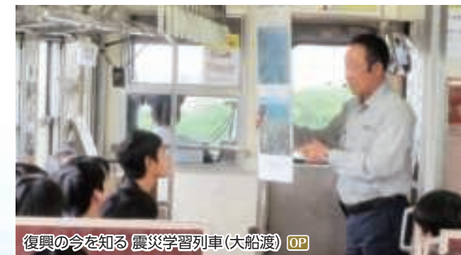
復興の今を知る 震災学習列車(大船渡) OP

OP 三陸鉄道「震災学習列車」乗車と 陸前高田・奇跡の一本松を訪ねて ① 東日本大震災津波伝承館、奇跡の一本松、鉄の歴史館、 三陸鉄道「震災学習列車」乗車(唐丹駅～盛駅) ◆所要時間:約7時間 ◆お食事:ホタワカ御膳の昼食付