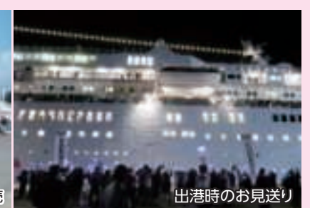
出港時のお見送り

写真は以前寄港した際のイメージです。当日の内容とは異なります。また、新型コロナウイルス感染状況等により中止変更になる場合もございます。