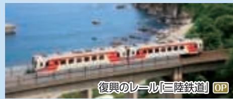
復興のレール「三陸鉄道」OP

復興のシンボルでもあり、“さんてつ”の愛称で親しまれ、大震災での被害から8年を かけ全線復興した三陸鉄道の乗車体験を初め、復興の歩みや教訓を感じられる ツアーもご用意しました。