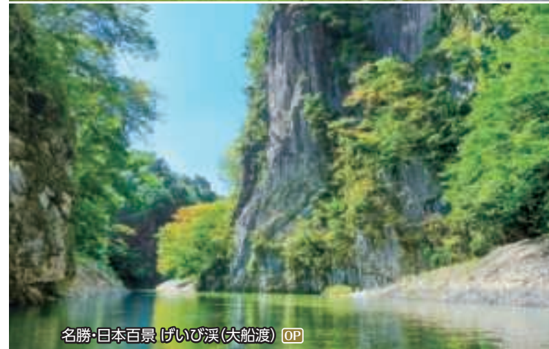
名勝・日本百景 げいび溪(大船渡) OP