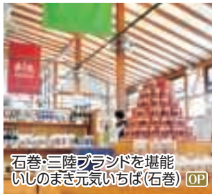
石巻・三陸ブランドを堪能 いしのまき元気いちば(石巻) OP

OP 海から望む日本三景 松島遊覧と国宝・瑞巖寺 松島島めぐり遊覧船、瑞巖寺 ◆所要時間:約4.5時間 ◆お食事:なし