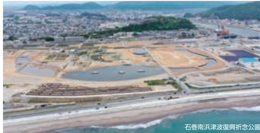
石巻南浜津波復興祈念公園

東日本大震災の事実と教訓を伝承し復興の姿を発信する施設として復興祈念公園が整備されています。