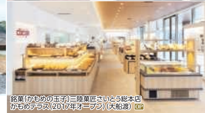
銘菓「かもめの玉子」三陸菓匠さいとう総本店 かもめテラス(2017年オープン)(大船渡) OP

震災後に地域活性化への想いをこめてつくられた各地の自慢の食材が味わえる“ご当地グルメ”の昼食付