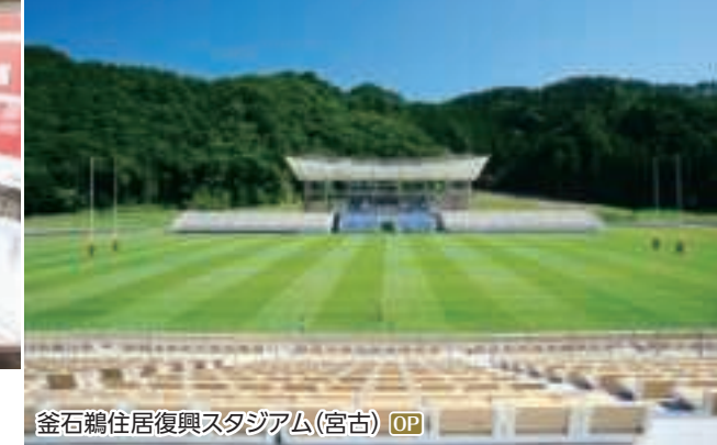
釜石鶴住居復興スタジアム(宮古) OP