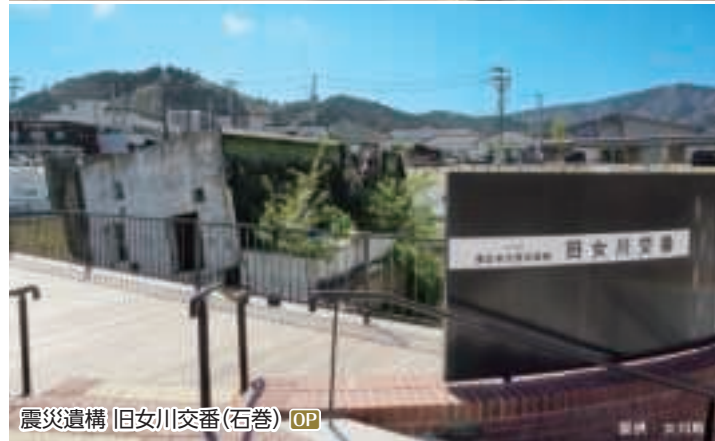
震災遺構 旧女川交番(石巻) OP