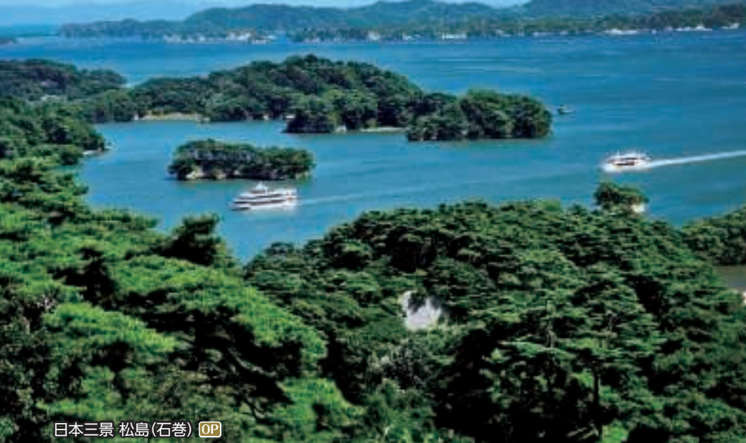
日本三景 松島(石巻) OP