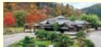
旧伊達伯爵邸 鐘景閣(石巻) OP

OP 日本三景・松島と杜の都・仙台 伊達政宗ゆかりの地めぐり I 仙台城(青葉城)址、瑞鳳殿、松島島めぐり遊覧船 ◆所要時間:約8.5時間 ◆お食事:旧伊達伯爵邸 鐘景閣にて筆筒ミニ膳(仙台筆筒料理)の昼食付