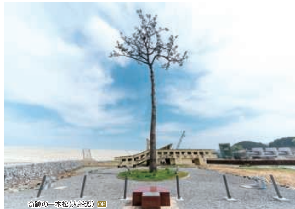
奇跡の一本松(大船渡) OP

OP 金華山特別祈禱と女川町の今を知る旅 ① 霊島 金華山黄金山神社(特別祈禱)、震災遺構旧女川交番、 シーバルピア女川、蒲鉾本舗高政(製造工程見学) ◆所要時間:約8時間 ◆お食事:昼食付