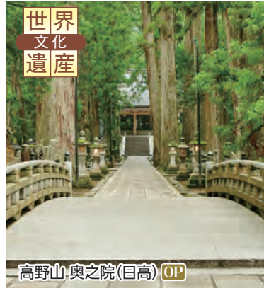
高野山・奥之院(日高) OP