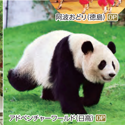
アドベンチャーワールド(日高) OP