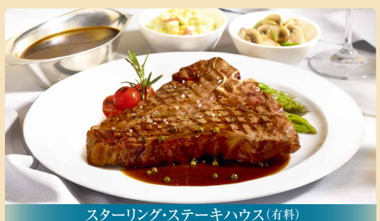
スターリング・ステーキハウス(有料)