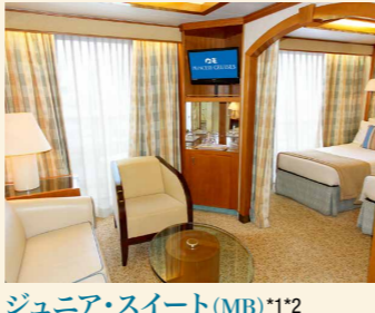
ジュニア・スイート(MB)*1*2 プレミアム・ジュニア・スイート(MI)*1 バスタブ、バルコニー付き 約34㎡

*1:全室、鉄板で囲まれたバルコニーとなり、お部屋内部からの視界が遮られます。 *2:車椅子対応客室にはバスタブはありません。