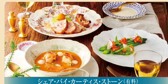
シェア・バイ・カーティス・ストーン(有料)