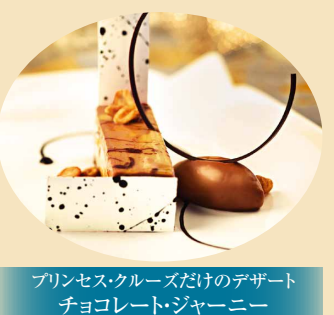
プリンセス・クルーズだけのデザート チョコレート・ジャーニー