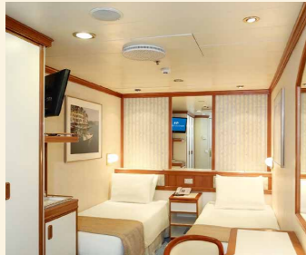
内側(IE・ID) シャワー付き 約14㎡