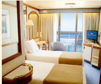
海側バルコニー(BE・BB)*1 シャワー、バルコニー付き 約17㎡