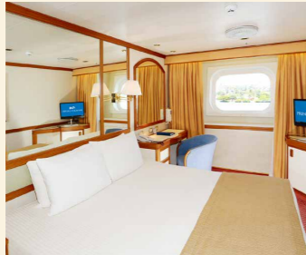
海側(OE) 海側プレミアム(O5) シャワー、角窓付き 約12㎡